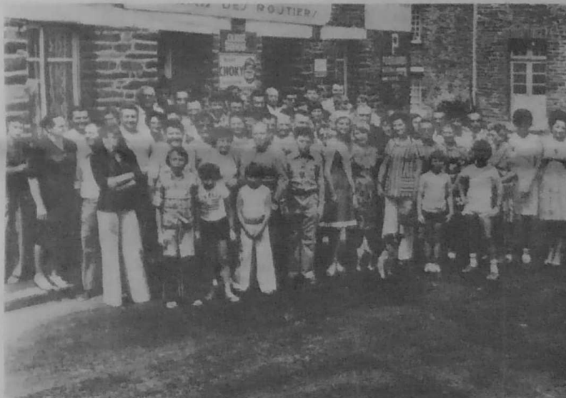
Les Bretons de Villiers-sur-Marne (et des environs) s'étaient donné rendez-vous le 12 août dernier à Beignon (Morbihan). Ils se sont donc retrouvés au nombre de soixante-dix environ. Ce fut un entracte dans les vacances. Quelle joie et quelle ambiance ! Depuis les Bretons de Villiers ont effectué leur sortie automobile vers Comptegny (voir page 3)

BOURSE DU TRAVAIL, 140 rue Marius-Aufan, LEVALLOIS (92)