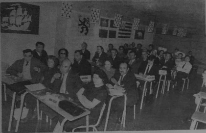
Quelques-uns des délégués à notre Congrès

Nous demandons que des mesures soient prises rapidement pour améliorer la situation économique de la région bretonne et que des mesures soient prises rapidement pour améliorer la situation économique de la région bretonne.