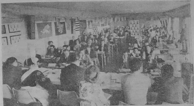
Vue générale de la salle du Congrès à Goussainville (95)

devant le Congrès de l'Union des Sociétés Bretonnes de l'Île-de-France