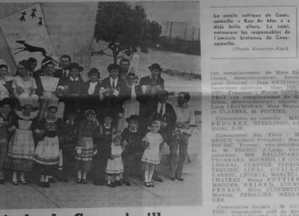
Le cercle culturel de Goussainville à Kan Ar Mor à deux heures, le soir, restaurant les responsables de l'amicale bretonne de Goussainville.

Le cercle culturel de Goussainville à Kan Ar Mor à deux heures, le soir, restaurant les responsables de l'amicale bretonne de Goussainville.