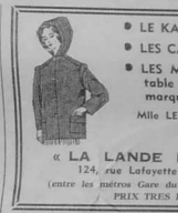
« LA LANDE BRETONNE » 124, rue Lafayette - PARIS-10 (entre les métros Gare du Nord et Potosennes) PRIX TRÈS ÉTUDES

Trois ruptures de canalisation de gaz en trois mois dans un même quartier ont entraîné quatre morts. Trois ruptures de canalisation de gaz en trois mois dans un même quartier ont entraîné quatre morts.