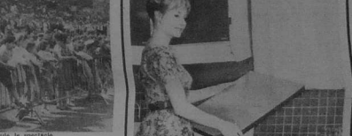
La machine à laver BARETTE super de LADEN. Elle se gère automatiquement et se transforme en séchoir muni de contrôle à son plan de travail.