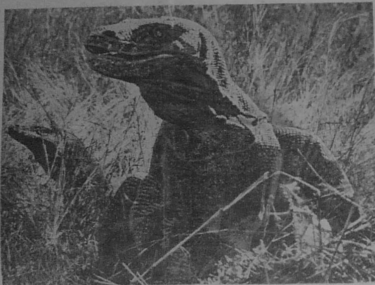
UN VARAN, représentant d'une espèce découverte en 1912, sur l'île de Komodo (archipel de la Sonde). Relique de la grande faune reptilienne de l'époque jurassique.

Cette offre unique porte sur la collection « Panoramas d'Histoire » (sept volumes parus, un à paraître : « Moscou et les Moscovites »). Un neuvième ouvrage, d'une valeur de 57 F., vous est gracieusement offert. Le règlement peut être effectué à raison de 33 F. par mois.