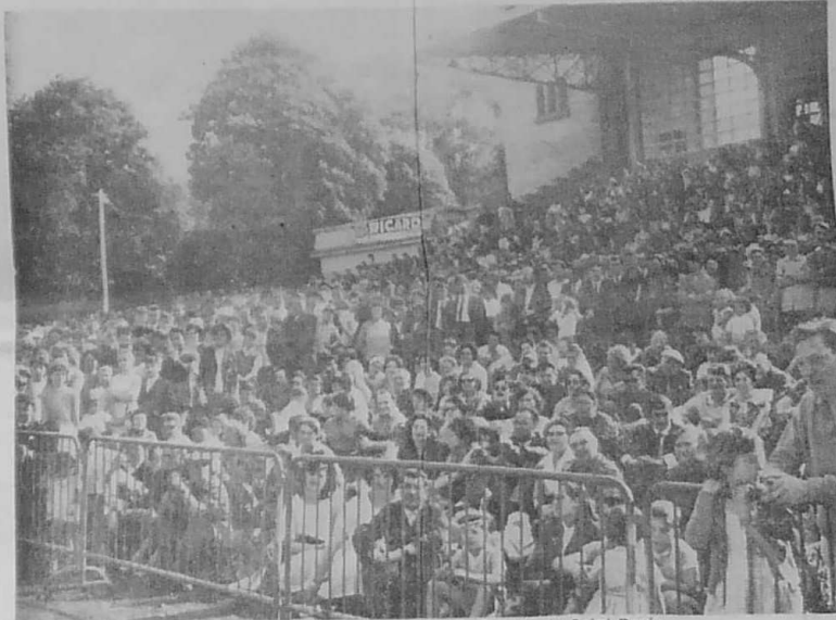
Une partie de la foule au Parc des Sports pour le 25 e Pardon de Saint-Denis