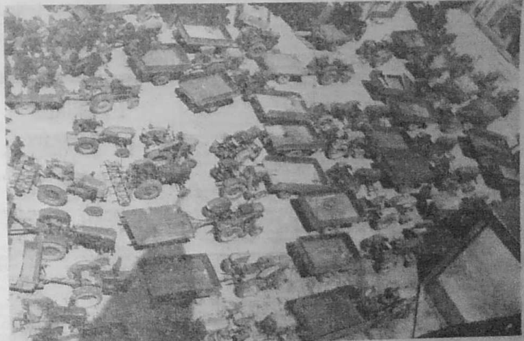
Aux Bretons qui viennent d'arracher un premier succès.

(*). Téléphonnez à ODEon 68-46, aux heures de permanence, ou écrivez à l'Union des Sociétés Bretonnes de l'Ile-de-France 19, rue du Départ, Paris-14 e .