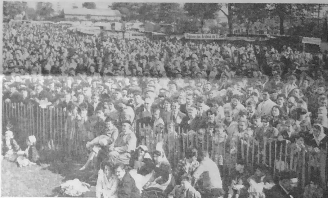
Une partie de la foule massée devant le podium pendant le spectacle. On ne veut pas en perdre une miette