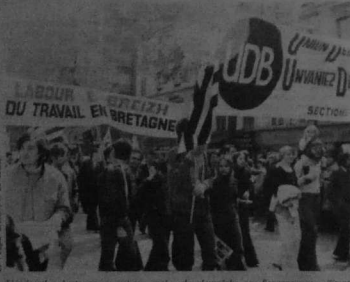
L'inspiration bretonne, en cette... mais cela d'empêche pas l'engagement militant comme on le voit dans la présence de nos camarades U.D.B. au défilé du 1er mai.

Sauberge ti-ar-menez RESTAURANT Brières - Spécialités LORIGNAN - 91 73 44