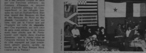
La Salle du Congrès U.D.B. de Mor-de-Bretagne était décorée des emblèmes nationaux des délégations étrangères.

Les délégations étrangères au XIII e Congrès de l'U.D.B.