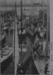
En Haute-Bretagne comme en pays breton, l'invasion du tourisme de luxe.

violon, la langue et des traditions alimentaires et vestimentaires individualisent la Haute-Bretagne qu'il faut le relier comme « française ». Outre le peu de signification de cet adjectif, il faut dépasser la dualité consistant de la Bretagne en la reconstruisant. Les bretons ne croit pas vers l'ouest, ce qui ferait des Finistériens ou des habitants d'ouest les plus bretons des Bretons. L'histoire montre au contraire combien Brest est une création française avec comme rôle de surveiller et d'assimiler les populations voisines. Or qu'elle habite en Bretagne, définis par une certaine histoire, une certaine culture, certains comportements et surtout une situation coloniale commune, les travailleurs ont des problèmes comparables.