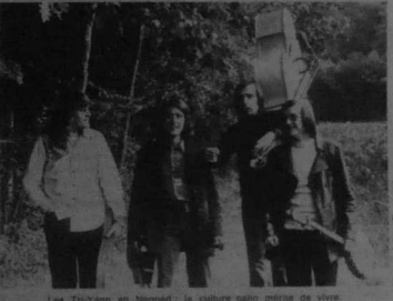
Les Trix, au Nannet: la culture gallo méritée de vivre.

Et la conscience collective bretonne n'a jamais complètement fait défaut, en pays gallo. On sait que le mouvement politique breton y est né, que 70 communes de Loire-Atlantique sur 220 ont émis un vœu en faveur de l'enseignement du breton et soutenant l'action du Célé à l'époque de sa combativité, représentant près de 80 % de la population du département. En Ile-et-Vilaine, ce sont 76 communes qui ont voté en faveur de l'enseignement du breton, soit environ une assemblée régionale à poursuivre réels regroupent les élus au au-tour universel des 5 départements bretons, soit voilà les 2 vœux. Si dans la population, il y a parfois hésitation à affirmer son appartenance bretonne, c'est par comparaison à l'égard du Finistérien, sage à tort dépeint du véritable « fond breton ». Ce complexe disparaît souvent lors des conflits sociaux: les présidents du Jost Français, de Plémet et de Saint-Carreac en 1972, presque tous gallois, ont affirmé eux-mêmes le caractère breton de leurs luttes