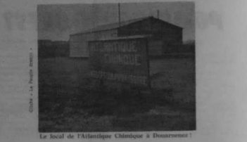
Le local de l'Atlantique Chimique à Douarnenez.

Mais, le 18 septembre 1977, le directeur de la Société informait les journaux locaux de son prochain départ pour... les Landes.