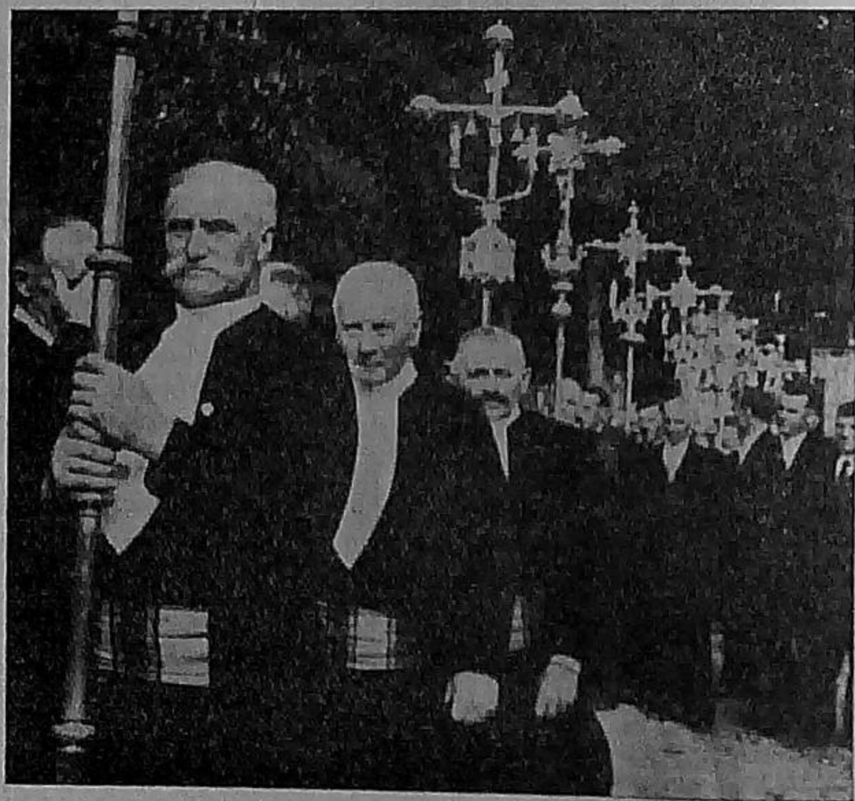
La procession au Bleun-Brug de Saint-Pol-de-Léon.