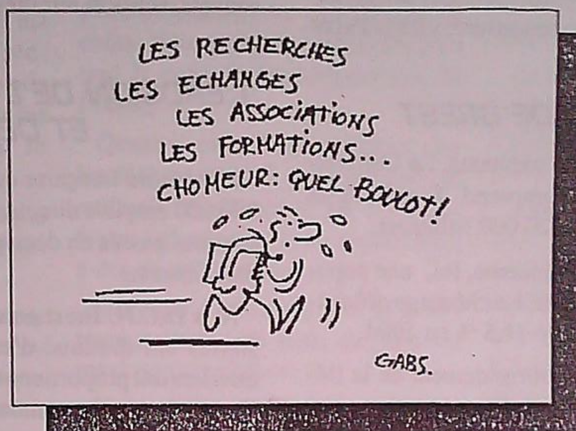
Ce qu'il faut éviter...

Après la publication du rapport Conze, relatif à la