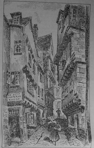
Banell ar brenn

Diskaret he c'hemwerz, dre ma n'he devoa ket ker a dud pinvidik bras, Montroulez, hanter gousket, a