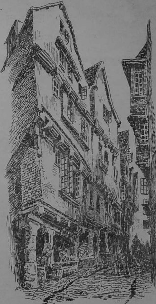
Ar Ra Vras

Anna Vreiz a deus da Vontroulez, er bloaz 1506; kinniget e voe d'ez eun herming zony, eur c'helic'had perlez en dro d'he gouzoug; al loenig gwenn a lammas diwar brec'h ar rounez war he larenn, ar peza reas aoun d'ez eun tamm, met an Aotrou Rohan he dispontas dillo: « N'eo ket da d'eoec'h kaout aoun,