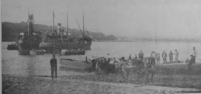
Plougastelliz o kas o sivi d'an Treiz