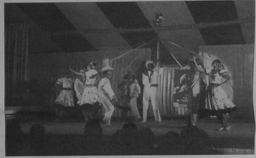
EL DITIRAMBO DE CARACAS-VENEZUELA 1er International d'Auray du 10 au 14 juillet 1986.

DEVENEZ MEMBRE BIENFAITEUR Plusieurs possibilités de soutien vous sont offertes : Tél. 97 56 20 après 19 h (Président) 97 24 00 43 (Trésorier) Fax. 97 56 61 01