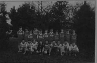
13 ans IV-AURAY, saison 94-95. Tournoi en Salle Challenge LE DOOR.

Les participants qui partaient ravivés se sont déjà promis de revenir l'an prochain.