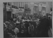
Bonhomme Carnaval, défilé et placé sur un rail, devant l'édifice dans un crépuscule de plomb, au soleil qui se couche sur les bords de la mer. La soirée s'est prolongée malgré le froid, près de la maison de quartier de St Goustan, avec le musicien pour danser et le spectacle des musiciens et du vin chaud. Dans les stands de cuisine et de boissons.

Après 25 ans de silence, le carnaval d'Auray reprend l'année prochaine. C'est une manifestation remarquable à voir dans les rues de la ville, au cœur de nos quartiers. Nous nous sommes réunis pour organiser nos activités, nous nous sommes réunis pour organiser nos activités, nous nous sommes réunis pour organiser nos activités. Après 25 ans de silence, le carnaval d'Auray reprend l'année prochaine. C'est une manifestation remarquable à voir dans les rues de la ville, au cœur de nos quartiers. Nous nous sommes réunis pour organiser nos activités, nous nous sommes réunis pour organiser nos activités, nous nous sommes réunis pour organiser nos activités.