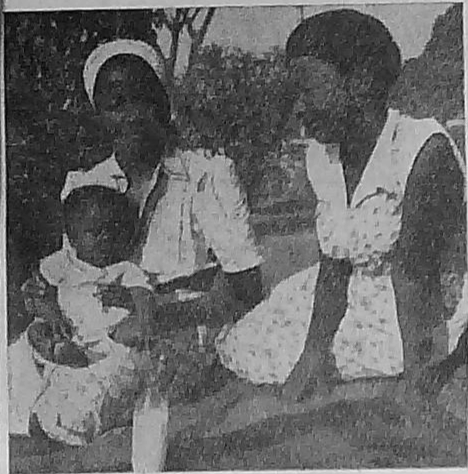
Chrétiennes Zouloues de Durban.

« Kared am bije klevéd muioh, med an daolenn vurzuduz a deuzas. Neuze oun dihunet. Eun eil gwech am eus grèet an hevelep huñvre. Ha bremañ oun laouen, rag komprénet am eus an huñ-