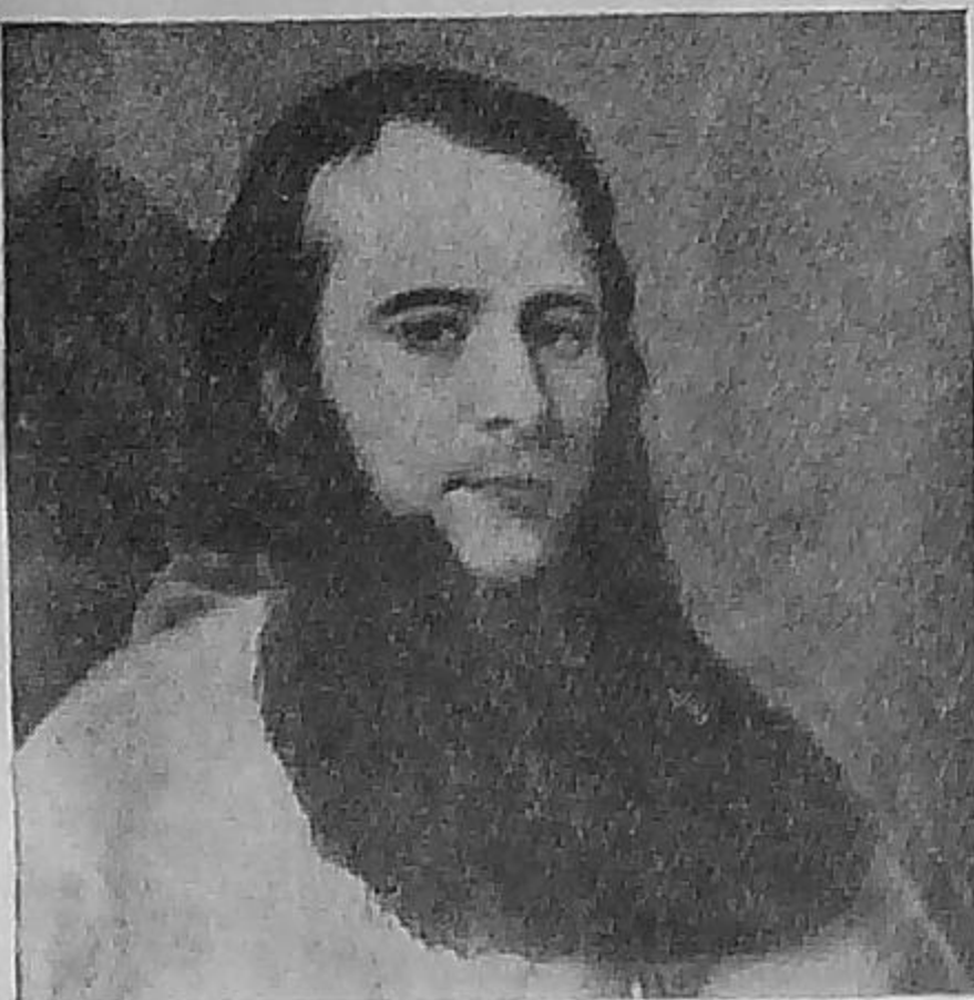
Monseigneur de MARION BRÉSILLAC, Fondateur de la Société des Missions Africaines.

Je suis sûr que les lecteurs du « Lizeri Breuriez ar Feiz » aimeront savoir dans quelle mesure le Finistère est allé grossir les rangs