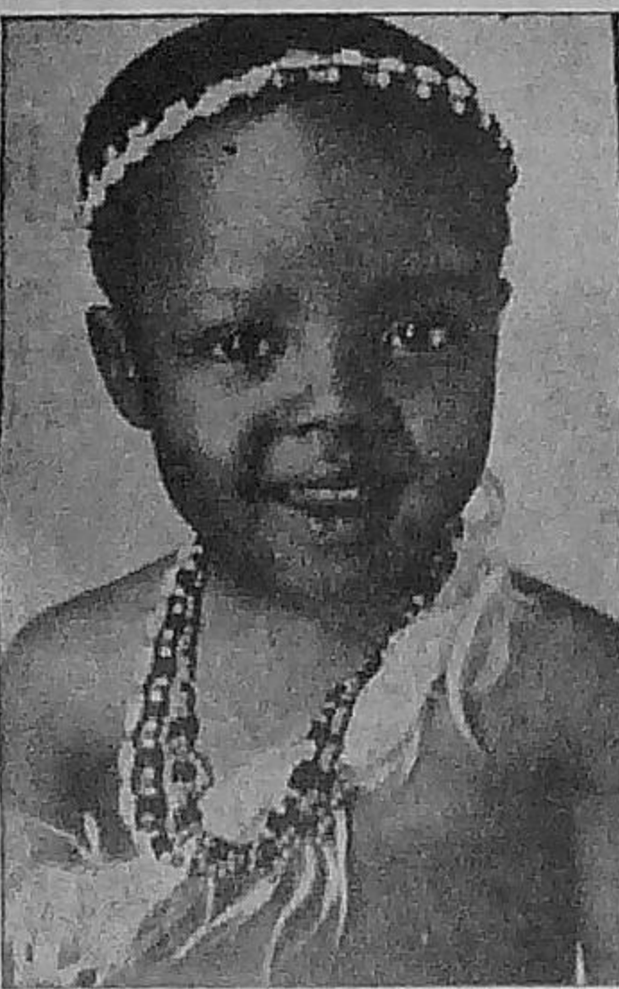
Un petit Zoulou.

— Léz ar gwalleuriou-se, Bonguilée. Ankounac'ha kémend-se, a lavaran dit. Da vugel a zo eüruz er baradoz ; sikour a raio ahanot