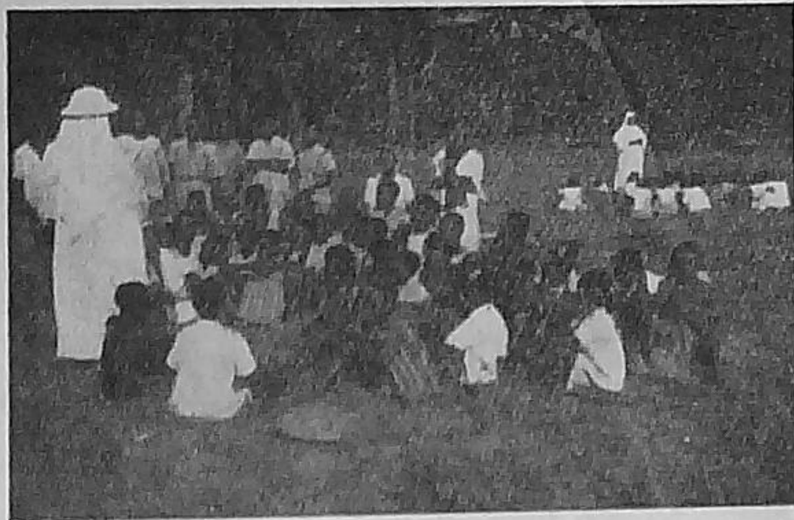
Côte d'Ivoire. — Catéchisme dans un village, à la sortie de l'école, à un groupe d'écoliers de l'école officielle. Au fond, une Religieuse noire avec sa section.

Deux fois la chapelle fut détruite par le feu. Les Pères la recommencèrent et décidèrent finalement de construire une église en dur avec une toiture de tôles. Le travail fut long et pénible, car les ouvriers étaient peu nombreux et inexpérimentés.