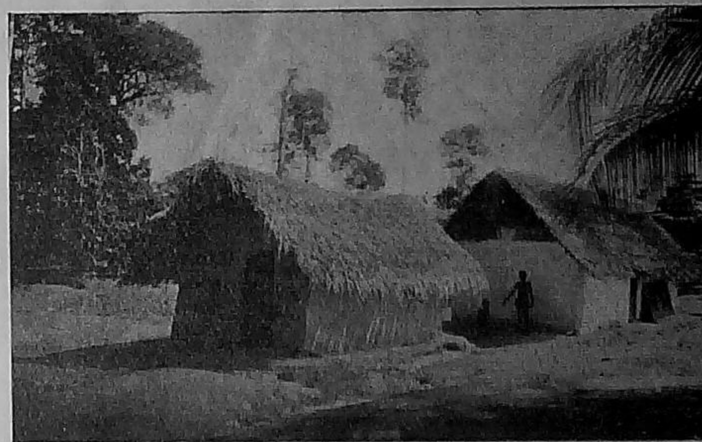
Côte d'Ivoire. — Église Catholique à 15 km. de Soutre.