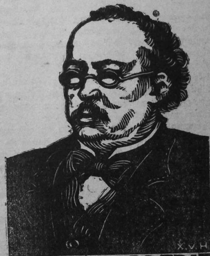
A. DE LA BORDERIE