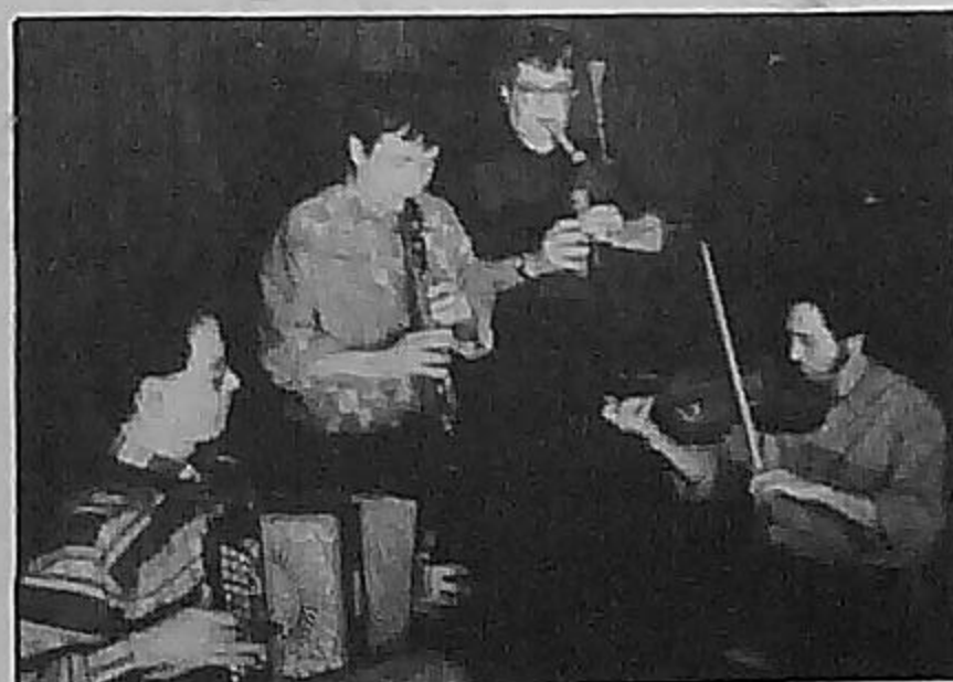
B F. 15