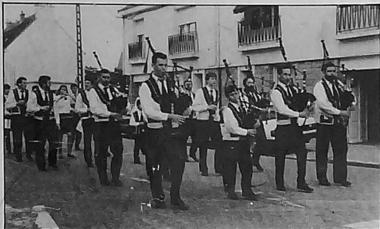
BAGAD DE PONTIVY