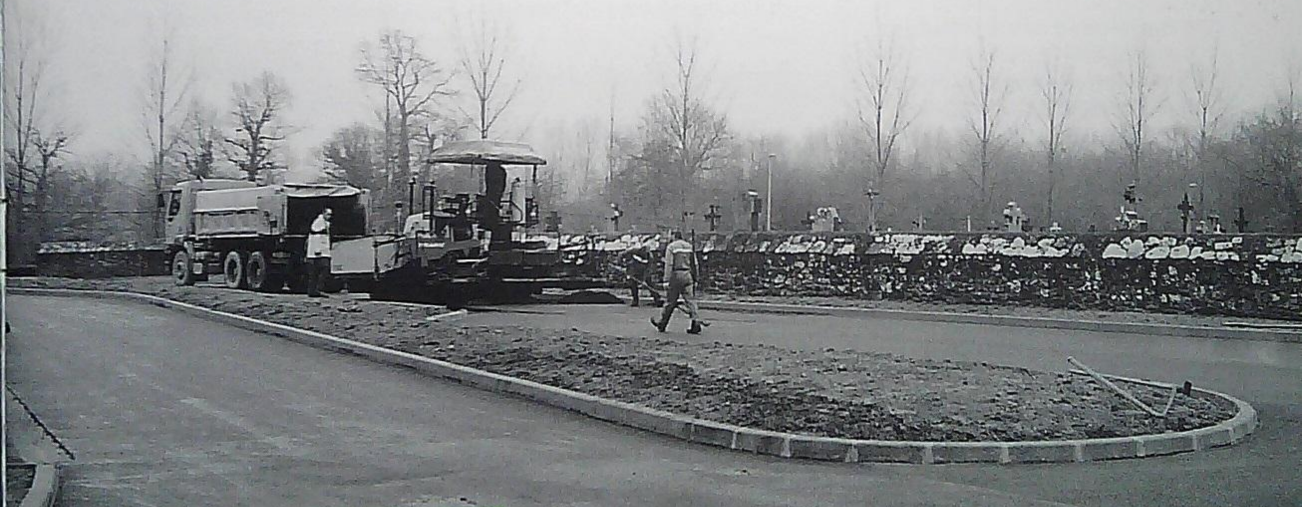
→ Travaux au parking du cimetière

Après discussion, le conseil municipal, à l'unanimité, décide de faire chiffrer le coût financier de la démolition et de la reconstruction du mur avant de prendre une décision et autorise le Maire à négocier avec les riverains concernés le prix des emprises calculé forfaitairement suivant la superficie nécessaire.