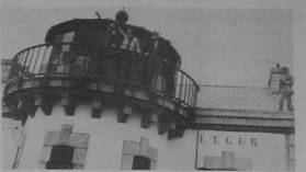
5. Une habite au vieux phare de Beq-Léguer.