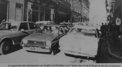
La suppression de stationnement rue Geoffroy de Pontblanc est à l'étude, dans le but d'élargir la voie de circulation et également les trottoirs.