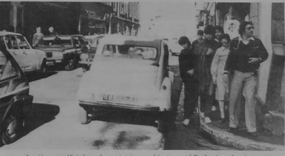
Les piétons sont obligés de prendre certains risques, se faisant souvent injurier de près par les voitures.