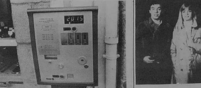
Horodateurs à son usage habituel, ces horodateurs du Centre et qui d'habitude fonctionnent comme une montre, ils sont maintenant nécessaires à l'équipement des centres-club. Ils indiquent pas à pas le coût, près du centre, plusieurs parkings gratuits.