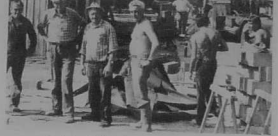
Une équipe de bénévoles qui se relaie sur le chantier pour reconstruire la nouvelle salle du quartier de Goas-Congar.

Animé par une sympathique équipe de bénévoles, le quartier de Goas-Congar va recevoir une nouvelle bâtisse. L'ancienne, vieille de treize ans, avait abrité de nombreuses manifestations, mais elle était devenue trop exigüe et assez délabrée. C'est ainsi que l'équipe s'est donnée rendez-vous pour démolir l'ancien bâtiment et commencer la construction de la future salle.