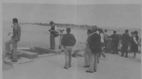
8. Un petit tour de côte sous le soleil. Du panorama de Perros-Guirec, la vue sur l'île Tenez et les Sept-Iles.