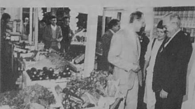
16. La visite des halles le jeudi, un spectacle haut en couleurs.