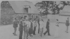
7. A la découverte des installations de l'A.C.E.V. : ici, la ferme de Kerligonan.