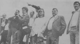
6. La vue est excellente du panorama de Beq-Léguer d'où l'on aperçoit le site magnifique de l'usine.