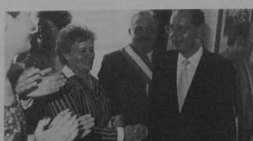
22. Poignées de mains et congratulations après l'échange de discours.