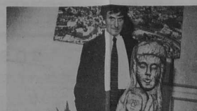
23. Le cadeau de Lannion à Günzburg : une très belle sculpture, la mère et l'enfant, de M. Pizent, de Trézel.