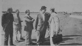
1. A son arrivée à l'aéroport, la délégation officielle de Günzburg a été accueillie par les élus de Lannion.