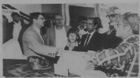
14. Au C.N.E.T., on s'est intéressé au procédé CYCLOPE, de localisation des personnes.