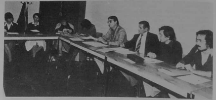
L'Assemblée générale de Lannuon O'Vevan