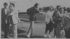
2. Pour certains qui avaient fait le voyage à Günzburg, c'étaient les retrouvailles entre collègues ou élus.