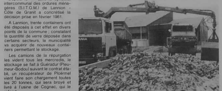
A Gervais, on stocke le verre ramassé pour l'envoyer à la fosse à Cognac.

Des ordures ménagères, valoriser les déchets. A l'heure des économies d'énergie, le recyclage du verre est une méthode qui gagnerait à se généraliser. Pour le département des Côtes-du-nord, localement nous sommes les seuls une population de 300.000 habitants pourrait être concernée par cette opération, ce qui représente 3.500 tonnes de verre correspondant à une économie de 280 tonnes-équivalent-pétrole. Le problème se situe donc à deux niveaux : il concerne la collectivité locale (sans de mise en œuvre) et la collectivité nationale en préservant les ressources naturelles et en réduisant les importations de matières premières.