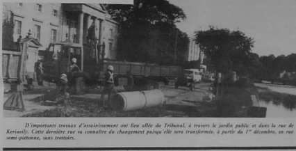
L'important travail d'assainissement sur l'axe allant de Tréhan à Tréven, le jeudi public, et dans la rue de Kerarity. Cette dernière rue va connaître du changement puisque elle sera transformée, à partir du 1 er décembre, en rue semi-piétonne, sans trottoirs.