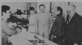
17. La halle aux poissons n'a pas été oubliée, lors de la tournée du marché.