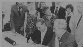
24. La signature officielle de document de jumelage rédigé en français, breton et allemand.