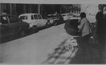
Il n'y a pas de place actuellement pour les landaus sur les trottoirs trop étroits.

Il est des rues, à Lannion, qu'il vaut mieux ne pas fréquenter lorsque l'on est piéton et encore plus quand on promène un landau ou des enfants. C'est le cas de nombreuses artères du centre-ville et plus particulièrement de la rue Geoffroy de Pontblanc et du bas de la rue Jean Savidan.