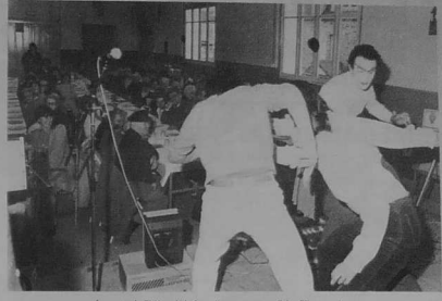
Le théâtre de la Lune Rousse a repris ses activités depuis le début du mois au centre Saint-Elvert.