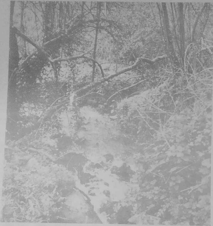
Un ruisseau sympathique dont les eaux vives descendent vers le Léguer.