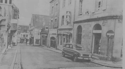
La rue de Saint-Malo.