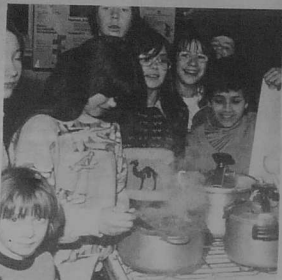
Les enfants de Ker-Uhel préparent eux-mêmes la cuisine, le mercredi, et mangent ensemble après.

Attention : les prêts de matériel ayant beaucoup de succès auprès des habitants du quartier, le centre a fait l'acquisition de : une table Black et Decker, une perceuse vibrante, une scie sauteuse, un chargeur de batterie.