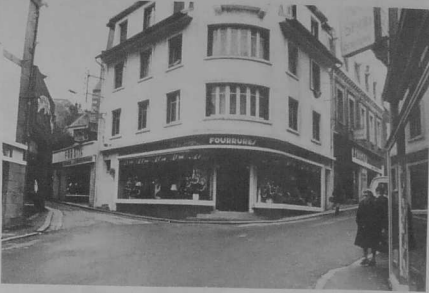
L'embranchement des rues de la Tour d'Auvergne et des Augustines.