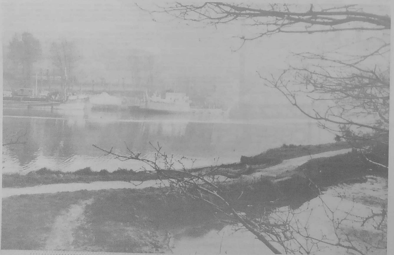
Surplombant le chemin de halage, le sentier offre au promeneur qui vient de Kerligonan, cette vue magnifique sur le port de Loguivy.

A l'abri du vent, le promeneur sera conquis par le charme de ce vallon où abondent les primevères dont les multiples taches jaunes parsèment les talus.