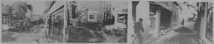
Le bas de la rue des Augustines.