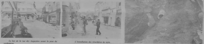
Le bas de la rue des Augustines avant le pose de revêtement.