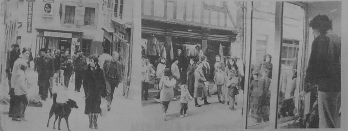
Toujours de l'animation rue des Chapeliers, avec un échaumé très véridique qui attire le regard.

La rue est aux piétons qui s'y promènent en toute tranquillité.