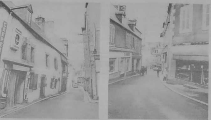
La rue Daguerlin.