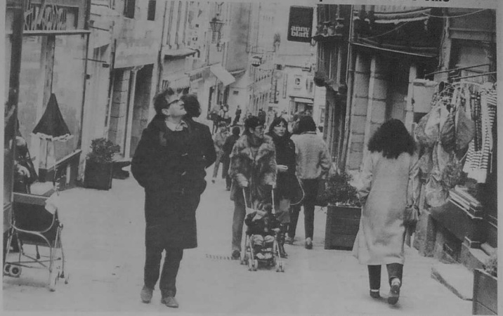
Une perspective intermédiaire de la rue des Chapeliers à la rue de Saint-Malo.