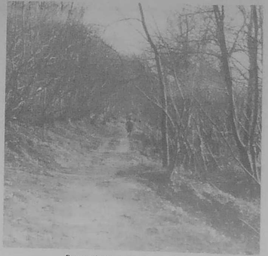
Promenade dans un chemin tranquille.