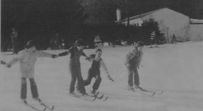
Les élèves de CM2 à Keriaden en classe de neige dans les Ynges.

Dans le cadre de la semaine d'animation, une ramontée du Léguer est proposée le 24 avril, à tous les volontaires. Le départ aura lieu au Beg-Hent, à 14 h.