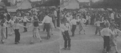
Les danseurs lors de la kermesse de Buhulien, en 1980.

En conclusion, l'amicale laïque, petite par son effectif, mais bien vivante, participe pleinement à toutes les activités scolaires et périscolaires de Buhulien.