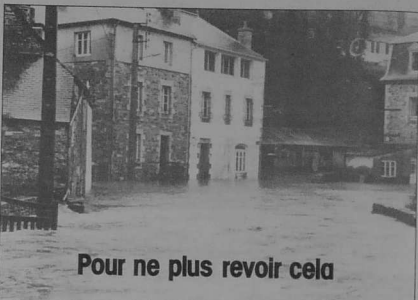
Pour ne plus revoir cela

La première solution est écartée dans un premier temps, car elle ne permet pas de résoudre totalement et de façon satisfaisante le problème.