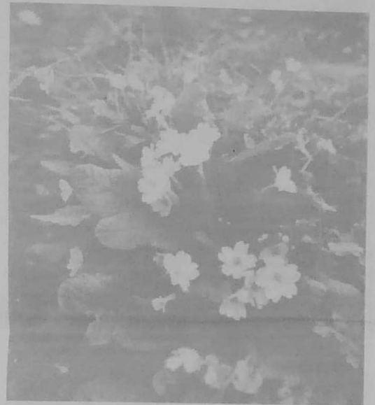
Les primevères ont trouvé là un terrain favorable.