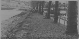
LANNION - Le futur chemin pour piétons entre les deux ponts.

1.440 APPS, 850 Unions des élèves du littoral, 500 Bibliothèque pour tous, 330 foyer IUT, 150 Maireries du Léguer, 330 aide aux mères, 7200 Vie libre, 700 Croix-rouge, 700 Croix-rouge sportive, 1800 Anis de la Terre, 300 500 personnes en difficulté, 660 Micro-Club, 500 Papiers blancs, 600 éducation sanitaire, 500 Air Foz, 500 école de musique de Saint-Breiz, 5000 Comité des fêtes, 35 000 Casse des écoles, 100 000 B.A.S., 400 000 dont 150 000 en salaires du personnel, foyer Dagorn, 120 000 foyer Coates, 100 000 office des retraités, 140 000, F.F.T. Saint-Avé, 18 000, office du tourisme, 65 000, OMS, 103 500, école de jeunesse, 15 000, Stade Lannionais (foot), 25 000, Stade Lannionais (basket), 7 200, ASPTT, 2 600, USL, 26 000, centre d'accueil, Saint-Elivet, 200 000, A.C.E.V., 360 000, C.S.B., 2 000 000, O.A.C., 175 000, W.O.A., W.E.P., 315 000, syndicat de l'agriculture, 1 650 200, association Rive Gauche, 19 850, Banque, 30 000, BRGM, 35 260, professeurs, 60 000. Au total : 5 927 739 F.