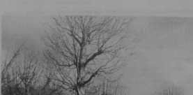
LANNION - Le square de la Poste, avant les travaux qui vont le transformer.