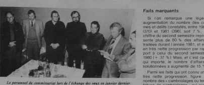
Le personnel du commissariat lors de l'échange des vœux en janvier dernier.