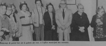
Rencontre de gais les de la galerie des rois, à l'office municipal des retraités.