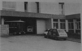
Le retour à l'hôpital. La RS revient toujours l'ambulance prête au service des urgences ou le blessé est attendu.