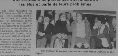
Une trentaine de personnes ont assisté à cette réunion publique de Beg-Léguer.