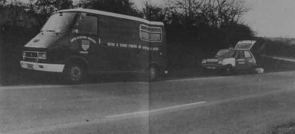
Sur la route, près du radôme, deux voitures arrêtées: l'ambulance des pompiers et le véhicule du S.M.U.R.