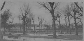
LANNION - La square de la Poste, avant les travaux qui vont le transformer.