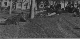
LANNION - Le square de la Poste, avant les travaux qui vont le transformer.