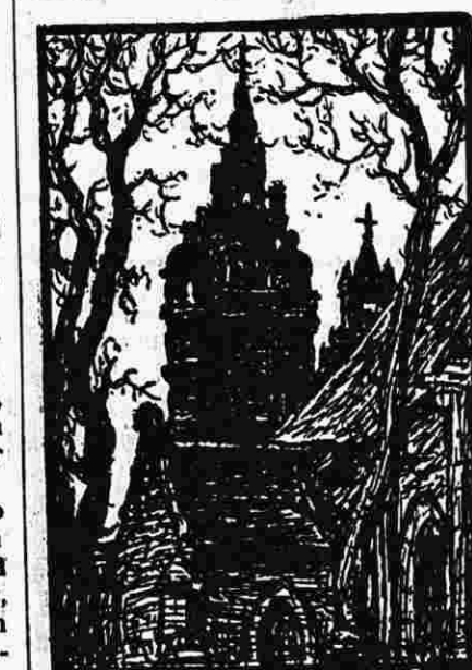
KLOO'HDI ILIZ ROZKO

Rozko a zo eun hañvlec'h brudet dre-holl e Bro-C'hall hag e Bro-Saoz. Dont a ra dezi bep bloaz milladou a douristed. A vil-vern e vezont gwel-let bep hañv o velen a chroc'hen war he aodou roc'hellek ha traizek, slouaz ! da vuhez kristen ar barrez ha d'ar brezoneg !