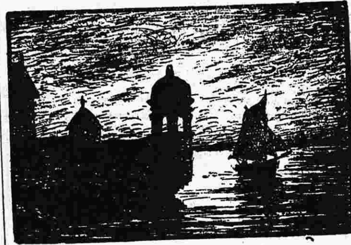
EUN DOURIBELL GOZ E ROZKO

Tud dreist e vefe Rozkoiz anez ma 'z eus etrezo eun tammig re a wariz. Emgleo hag unvaniez a rafe o nerz.