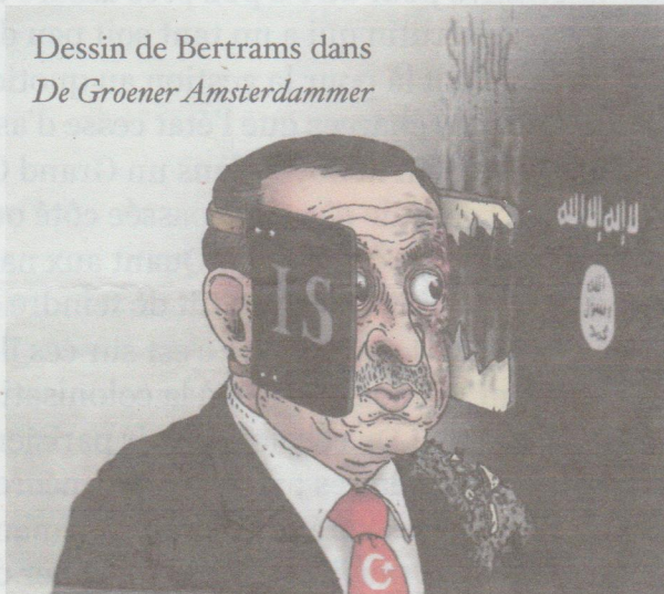
Dessin de Bertrams dans De Groener Amsterdammer

Tout le monde le sait dans la région : il suffirait de laisser faire les forces en majorité kurdes de l'YPG et du PKK. Non seulement Erdogan fait pratiquement tout ce qu'il peut pour paralyser les forces qui combattent vraiment l'EI, mais tout indique qu'il aide l'EI, du moins tacitement.