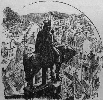
Gralon e kreiz etre touriou iliz-veur sant Kaourintin