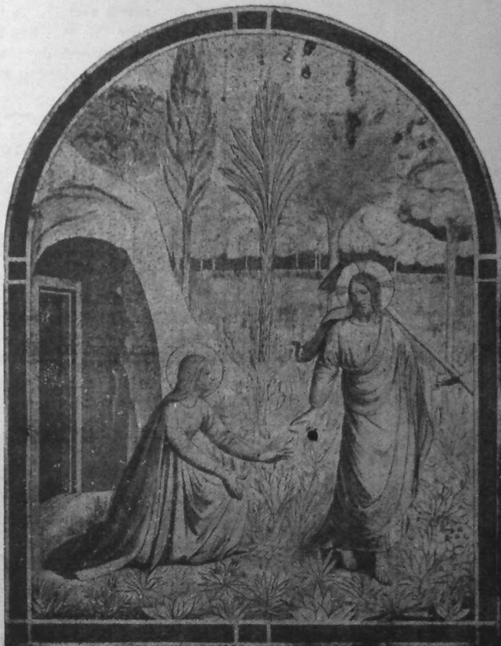
(Taolenn Fra Angelico).

An aotrou Jezus a zo beo, Gwelet eo bet e tal ar c'heo, Savet eus a varo da veo ;