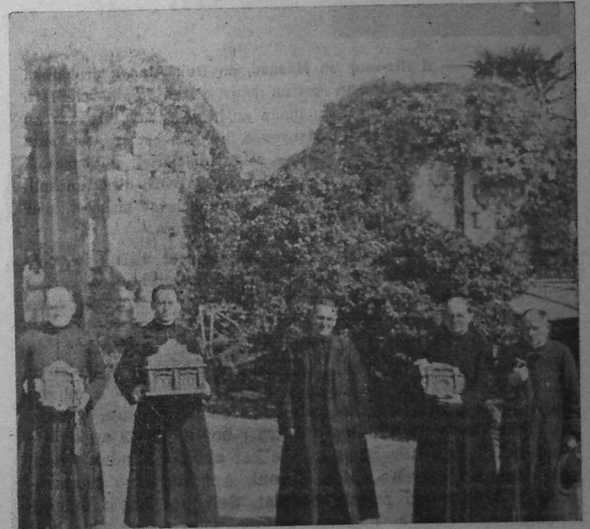
Ar veleien bet o kerc'het relegou sant Gwenole, e Landevennec, a-benn Goueliou Bleun-Brug Plougastel.