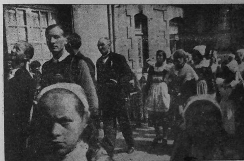
Prosesion Dirinon e Plougastel.