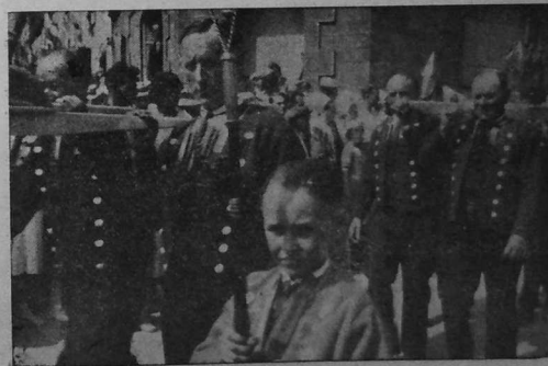
Relegou sant Gwenole miret e Landevennec, Lokgwenole hag e Montreuil, douget gant Plougastelliz. (Skeudennon an « Ouest-Eclair »).