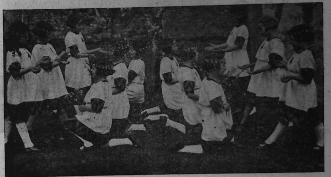
Merc'hedigo Skol gristen Gwerleskin e koroll ar Balan alaouret, a voe diskleriet ganto en eun doare dispar evit ar wech kenta...

Holl asamblez, dansomp ha kinomp gē Dindan heol an amzer nevez Tra la la la, la la la la la la..