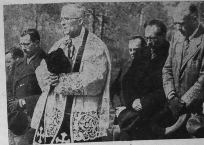
E kout Katyn, izili Kroaz Ruz ar Pologn a bed evit o c'henvroiz laz et eno, a vilierou, gant ar Volcheviked gouez.

Tudou keiz, hag a gred n'eo ar volchevism nemet eur spontailh, Doue r'ho mouro diouz planedenn soudarded ar Pologn !