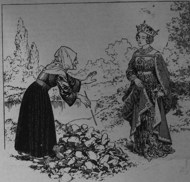
Gant he baz vuzudus, ar marc'heg a droas kercent en eur bern mein.

Degaset e voe ar roue d'ar gêr ha klasket ar vezeged (vedesined). Lavarout a rajont d'ezañ beza sioul ha dibreder, mirout a veza trefuet. A-benn eur sizun e wellafe d'ezañ. Start edo ar roue en e gredenn e oa aet gant an Itron gaer da welout an Inizi Aour, nemet ne ziskouezas kement se da zen. Pa wellas d'ezañ, e lakaas klask merc'h ar mesaer-moc'h, hag e lavaras d'ezani en devoa keuz da veza he mac'het dalc'hmata, nemet en devoa c'hoant azao hiviziken dirak an holl e oa hi e wreg, hag e lidfent bremañ eun eured reiz. Lakât a eure pedi da zont d'an eured tudjentil ar c'horn-bro, hag e teuas eur maread anezo. Pa voe an holl bodet, ar roue a c'halvas Daithi, ha pa voe deuet, e lavaras d'an dud : « Sed amañ va mab ; betek vremañ am boa e guzet. » Ar c'hiz a oa d'an ampoent gant ar glaskerien vara da zont d'an holl eureudou, ha zoken gant tud hag a zouge masklou. En taol-mañ ivez e voe eur guchenn vras