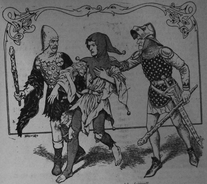
Tapet e voe krog er paourkêz jarwell..

— « Testeni a roin d'it gant va c'hleze, emezañ, n'oun ket eur gaouiad. »