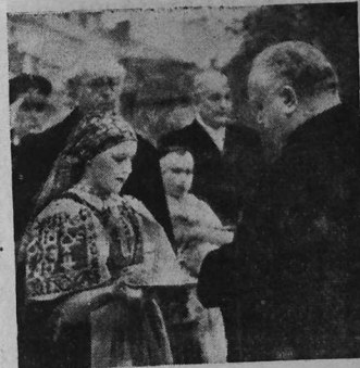
Merc'hed yeoanek diwar ar maez a zegemer an Aotrou Tiso, Pennrener Slovakia, hag hervez ar c'hiz koz, e kinnigont d'ezan bara hag holen an degemer mat.

Pa voe echu brezel 1914-18, Slovakiz a voe leun a fizians evit amzer da zont o bro : Gant skrid-feur Versailles goude ma voe dispennet Impalaerez Aostria-Hongria, e voe unanet Tchekiz ha Slovakiz en eur stad nevez : Ar republik Tchekoslovakiat. Met an emgleo-se etre an diou bobl ne badas ket. Ar stad nevez-se krouet e kreizenn Europa n'helle ket padout, daoust ma oa ennan 19 milion a dud rak ar re-man a oa eur strollad gouennou dishenvel : E kichen Slovakiz ha Tchekiz e veve 2 vilion a Alamaned,