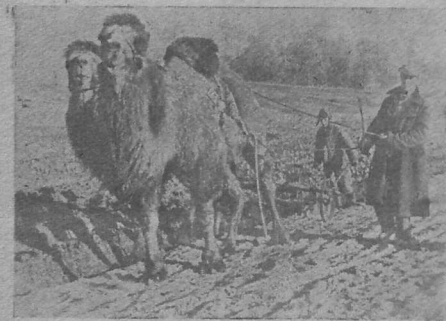
E Bro-Ukrain, dremadaled (dromadaires) a vez sternet ouz an alar evit labourat an douar...