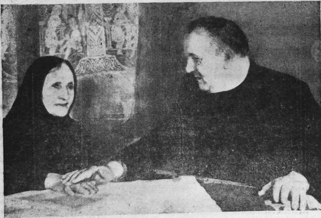
Dal ma ro aferiou ar Stad eun tammig amzer d'ezan, an Aotrou Tiso a ya da ziskuiza da di e vamm. War an hent souezus m'en deus kerzet warnan ar mab, spered ha lorc'h ar vamm o deus e heuliet.