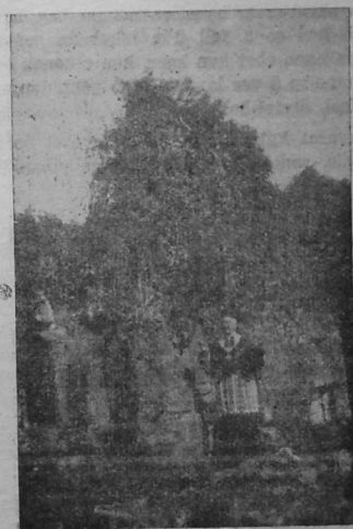
An Aotrou UGUEN o prezeg e iliz abati Landevennec, d'ar 4 a viz gwen- golo 1935, evit mil- vet bloaz distro ar venec'h.