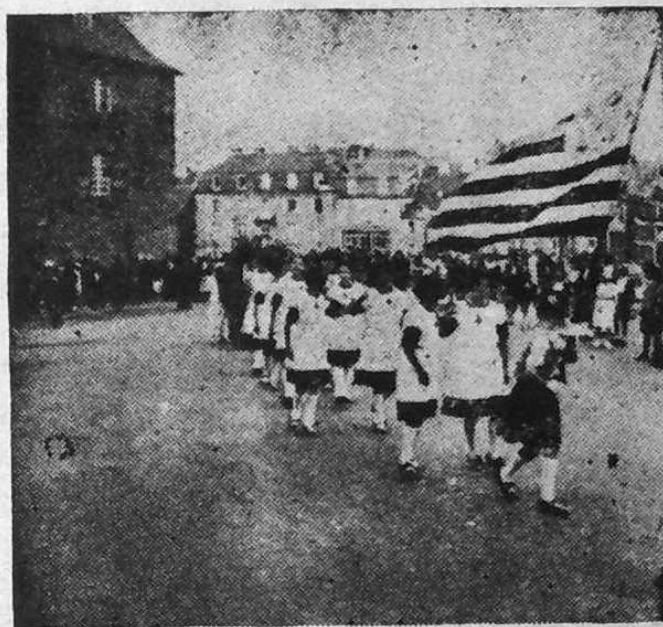
Bugale o tougen banniel nevez Breiz e Bleun-Brug Lanuon.