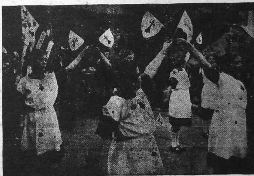
Bugale Gwerliskin o korolli en c'hor da vanniel nevez Breiz.