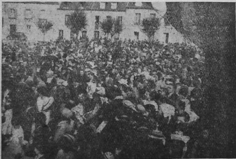
Eur c'horn eus an dud a oa war ar Marc'hallac'h d'ar 4 a viz gwengolo.