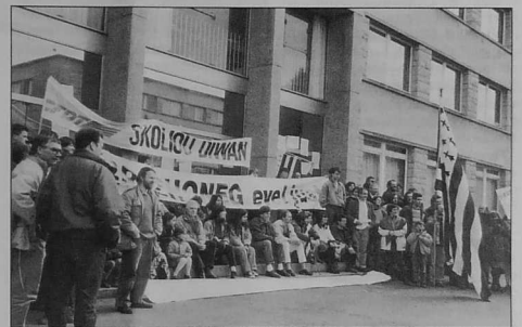
Implijidi Diwan dirak ar rektordi e Roazhon d'ar Merc'her 20 a viz Ebrel 94

O asant o deus roet an departamantoù hag ar rannvro evit sammañ war o choug ul lodenn eus an dleoù gant ma vefe sklaer statud Diwan, gant ma vo kempouez budjedoù ar bloavezhioù da zont, ha gant ma asantfe Diwan da baeañ ul lodenn eus an dleoù (25%). Evit ar pezh a sell ouzh ar statud, emañ Diwan war-nes asantiñ da statud al lezenn Debré, gant ma vo roet ar postoù nevez bet goulennet ganti. Da neuze e vefe roet kevratoù d'an dud ha d'ar skolioù dindan 4 bloaz.