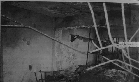
Skolaj distrujet gant an arme e kêr Tatvan evit mirout ouzh ar vugale da vezañ skolliaet