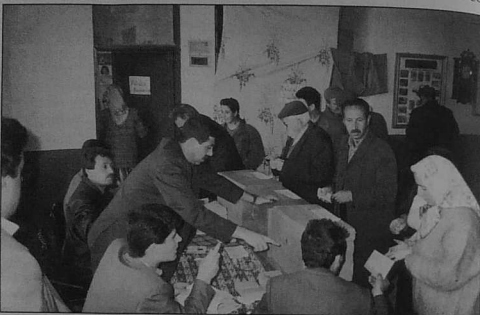
d'ar Sul e oamp bet e Tatvan hag hor boa arsellet ouzh an dilennadegoù

a vez o vont hag o tont er pezhioù-goude-se. Gant an islamourion an hini eo aet ar maout: n'eus nemeto evel dibab all estregret ar g-kemalouriezh, gwasket m'emañ an DEP ha nac'het outo kemer perzh en dilennadegoù. Hervez servijou kuzh Turkia ez eus 10% eus ar boblañs oberiant (tro 4,5 milion eo