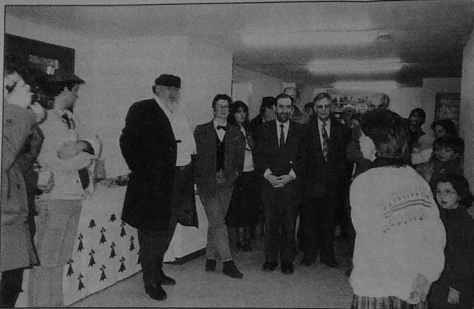
Digorañur ofisiel TI LIN e Kemper gant diennidi hag an dud o deus kemeret perzh el labour kempenn