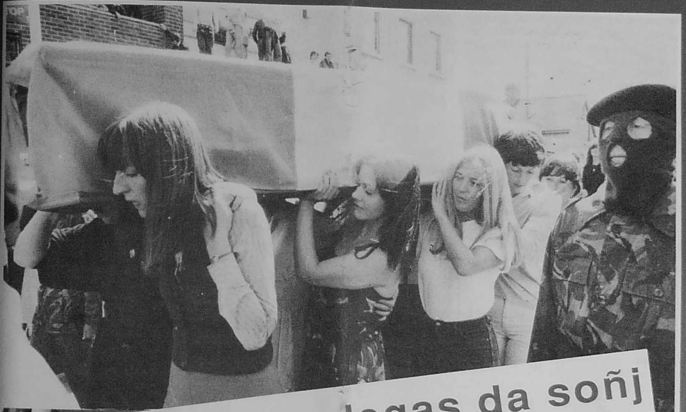
Iwerzhon : degas da soñj