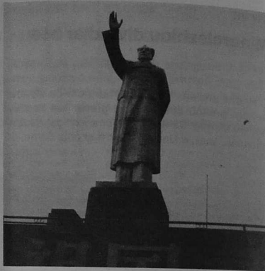
Kenavo I (Mao e Chegzhou e kreiz ar vro)

Dirak ar proviñsoù e koll mui-ouzh-mui galloud Beijing eus e bouez. Achu eo ivez gant an taol-arnod a "adarmañ ar vuhezgezh maoat" a savas goude "darvoudoù 1989". Ledanoc'h c'hoazh eo bremañ an touflez etre ar skouterzh broadelour a vez brudet gant Kostezenn Gomunour Sina ha dilez ar c'heal-se gant ar boblañs eget er mare kent "Tian An Men".