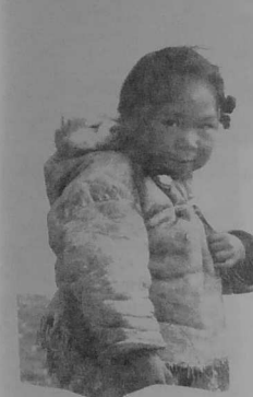
Plac'hig Same gant ur c'hi stejel

C'Hoant am eus lakaat ac'hanoc'h da anaout gwelloc'h un nebeut pobloù bihan ha ne glevet ket kaozeal kalz diwar o fennoù. Ar miz tremenet em boa kinniget deoc'h pobl Hawaï ar miz-mañ, avat, e kinnigin deoc'h ar bobl Same.