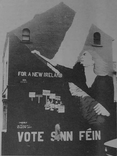
livadur war moger un ti e Derry