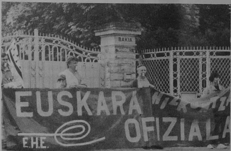
Bep a vanniell triv... dirak "Villa Bakia", lec'h m'eo annezet kuzul departamant ar Pireneoù Atlantek

Parti socialiste Fédération des Pyrénées-Atlantiques Secrétariat Pays Basque 63 rue Bourgnou - 64100 Bayonne ☎ 59 59 24 05 Bayonne, le 22 avril 1991 Plan départemental de signalisation bilingue