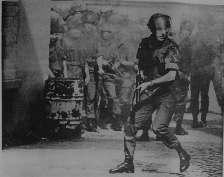
Soudarded kuzhet en ur straedig

oa ar pal. Gwanoc'h a se e vije an emsav republikan. Buan e trankas an traoù goude ar manifestadegoù kentañ. Feuls e teuas da vezañ ar bolis. Un dibab a oa d'ober neuze gant an emsav Republikan. Kenderc'hel gant ur stourm difeuls pe adkregiñ gant ar stourm armet ? Ne zeuas ket ar memes respont gant an holl. Kalz a re yaouank avat o wlelet sponterezh ar bolis ha Strolladoù Ledvilourel an unanelourien a yeas da lakaat kreskiñ niver izili an I.R.A. Un ober a emziñn e oa. Unan a vrezel e teuas da vezañ buan. 30.000 soudard ha polis armet a zo hiziv er c'hwec'h kontelezh. Lakaat anezho da guitaat ar Vro, setu a zo pal kentañ an I.R.A. bremañ.