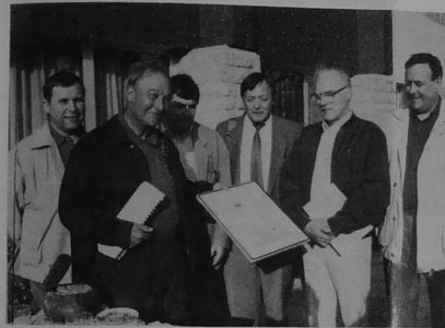
strollad aozañ Gouelioù Kerne o kinnig spilhenn "Gouelioù Kerne" (h.h.s)

70 vloaz zo dija ez eus gouelioù Kerne etre trede ha pevare Sul miz Gouere, ur festival anavezet eta gant ar pal kinnig arzoù ha gizioù poblek Breizh.