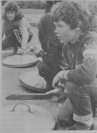
Bugale Derry e-tal d'ar soudarded