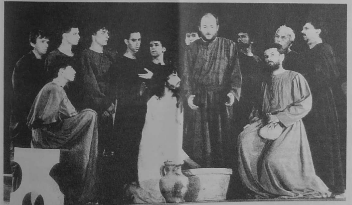
Ar Basion Vras c'hoariet e Roazhon e park an Thabor d'an 3 a viz Gouere

Ur plas a-bouez a zo d'ar sonerezh en abadenn-mañ. Sonerezh gant binvij koch an amzer-se, evel ma vez gwelet war ar c'halvarioù, war porchedoù, retabloù ha gwerennoù-livet an ilizoù. Sonerezh gant binvij a-vremañ ivez. Estreget binvij (ha binioù... rak