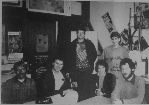
Dileuridi ar broioù deuet da breñtñ ar c'hendiviz e Roazhon

Etre an 20 hag ar 26 a viz Ebrl eo bet kenstrollet tud eus Europa a-bezh e Breizh Skosiz, Estoniz, Korsikiz ... etre tout ouzhpenn kant a dud yaouank deuet eus seizh avel Europa o deus en em gavet e Plafvour, ar gêr dibabet gant emvod-bloaz Yaouankizoù Kevredad Poblou Europa (JCEE), hag a zo bet savet a-ziwar an UFCE (Union Fédéraliste des Communautés Ethniques Européennes).