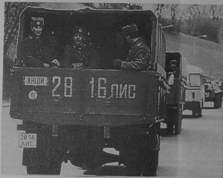
soudarded an Arme Soviedel e Bro-Latvia

E-barzh un niverenn gentañ eus Bremañ, e vo kontet doare ar stourm abaoe e-pad ar bloavezhioù diwezhañ, evel ma oa bet graet evit Litwania.