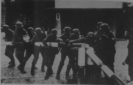
Soudarded nazi e 1939 o tenniñ an harzoù

Ha didrouzilh e voe ar vro betek miz Mae 1940 ; da hanter-Vezheven avat, en em strinkas An Arme Ruz war an teir Stad. Bep a ouarnamant a-du gant ar Gomonourien a voe lakaet dezhe, dre nerzh, gant Vichinsky, a lakaas ober "votadegoù" e doare Moskov. Kuit a doujañ ouzh lezenn-diaez ar stad, ec'h embanne ar SAEIMA (bodadeg vaur) nevez penaos e troe Republik Latvia en ur republik soviedel. Kregiñ a reas ar vistri nevez da bakañ tud, adalek an 11 ha 12 a viz Gouhelen 1940. Toullbac'het e voe prezidant ar Republik dizalc'h, Kārlis Ulmanis, hag e vinistred bet, d'an 21. Kaset e voe ar prezidant d'ar C'haokaz da gentañ, ha da Grasnovodsk en Turkmenistan, pa dostaas an Alamanned, Marvet e vije eno e miz Gwengolo 1942. Savet ez eus bet ur gomision da adkravout anezhañ met tro wenn he deus graet betek-hen. Adalek miz Here 1939 e oa bet gweliet gant an NKVD kas da get milieroù a Latviad barnet evel tud a-enep ar Soviedoù (ordrennañs 001223 bet sinet gant SEROV, eil-komisier eus Surentez ar Stad da neuze). Lakaet ez eus bet e voe harluet, etre miz Gouhelen 1940 ha miz Mezheven 1941, 35 000