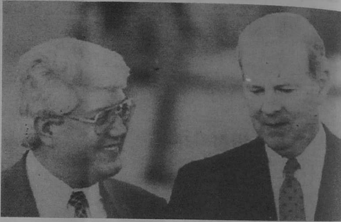
James Baker ha David Levy, ministr darempredoù Israel gant an estrenvroioù, o ren an diviz war Kuzuladeg Rannved Reter-kreiz

Seizh mizvezh zo bet a-walc'h evit skarzhañ armeoù Irak er-maez eus Koweit. Pevar bloaz warn-ugent goude o aloubidigezh e chom Sisjordania, Gaza, Reter-Jerusalem hag ar Golan dindan an estren. Kenderc'hel a ra Israel da wallgas divizoù Jeneva a-zivout gwarezidigezh ar poblañsoù ha Washington a bae.