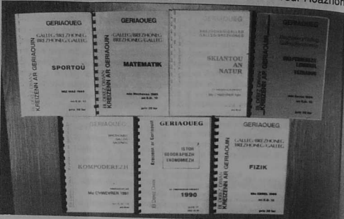
Ezhommoù divent da seveniñ