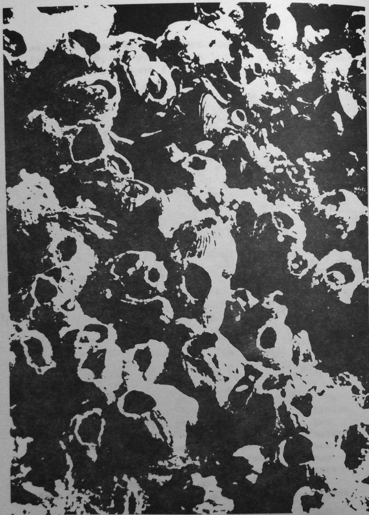
sk: d, jago

ha dreist-holl kuzhet mat en o loch. C'hwec'h kanol bremañ ! Ha penaos an diaoul e oa distro ar c'hanol-milliget-se er c'hazarn, goude ur bloavezh tremenet o kantren bro ? Sur-tre e oa bet gwelet pe glevet tra pe dra gant unan bennak ! Ne vez ket stlejet pe ziblasat ur pezh tra evel hennezh hep ober trouz, hep na vefe merzet gant, da vihanañ, ur c'hrak-kristen bennak !