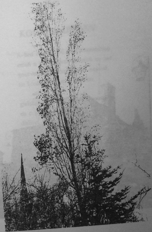
An elvenn el liorzh...