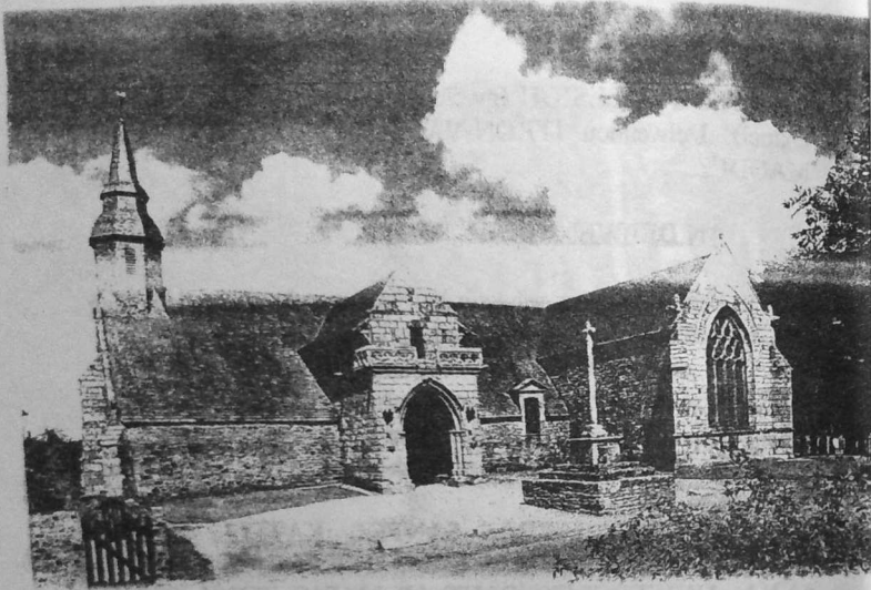
Ar chapel gwelet en he fezh