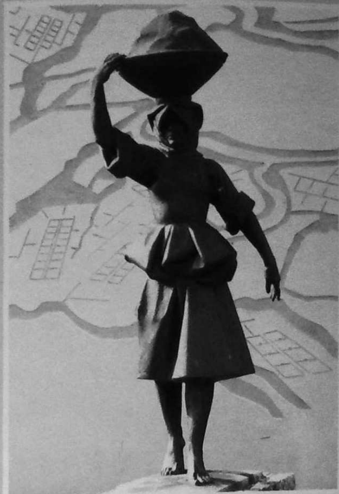
"LA PORTERESSE" sculpture et fresque de J. FRÉOUR