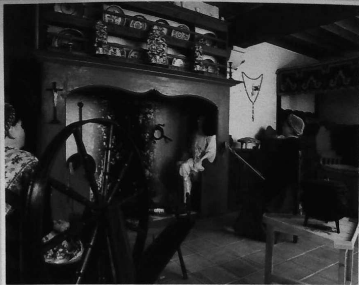
INTÉRIEUR PALUDIER