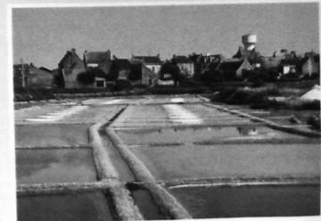
"SALINE SCOVENO A KERVALET EN BATZ"

Les ressources naturelles du marais salant permettent d'entrevoir une diversification des activités compatibles avec le milieu : cueillette de la salicorne, aquaculture extensive (élevage de palourdes, crevettes, turbots, ...).