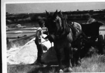
"ROULAGE DU SEL"