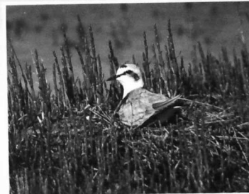
"GRAVELOT A COLLIER INTERROMPU SUR SON NID"

Le paludier récolte (de juin à septembre) deux sortes de sel :