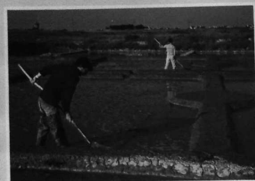
"CHAUSSAGE D'UN MARAIS"