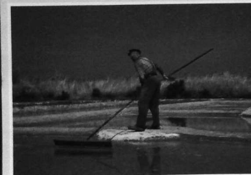
"RÉCOLTE DU GROS SEL"