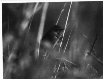
"GORGE BLEUE"

La mer irrigue le marais salant par l' étier au rythme quotidien des marées. En période de saunaison, tous les quinze jours, le paludier admet l'eau grâce à une trappe dans la vasière : vaste réservoir de décantation. De là, sous l'effet d'une légère dénivellation, l'exploitant met l'eau à tourner dans la saline à travers une suite de bassins aménagés dans l'argile : cobier, fards, adernes . Sous l'action du soleil et du vent, l'eau s'échauffe, s'évapore, sa teneur en sel augmente : elle devient saumure. Dans les œillets , le sel se cristallise.