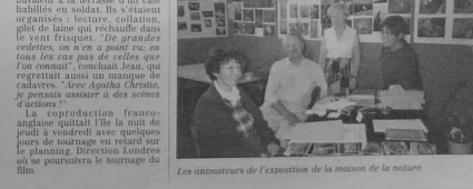
Les amateurs d'exposition de la maison de la nature

L'exposition se présente sous forme de panneaux, d'albums photos, de revues de création. Une riche bibliothèque confédération en plus de vingt livres sur le thème de la nature.