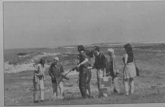
L'équipe de France 3 durant le tournage de l'émission