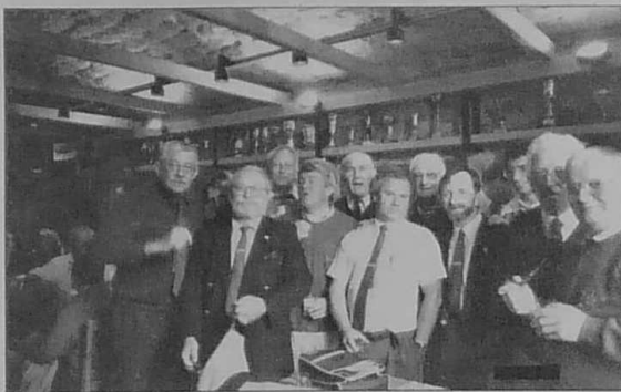
Le comité de direction du club nautique