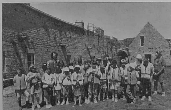
Le groupe dans l'enceinte de Fort Cygogne