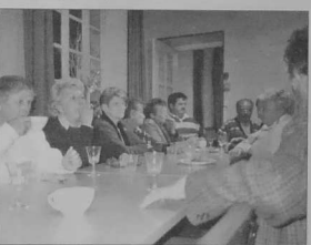
Après le champagne, le café, à la Maison des anciens du Ponant