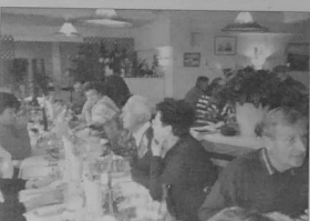
S'arrêtaient-ils jamais de parler ?