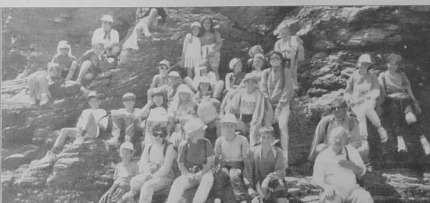
Les élèves de Meaudre font une pause sur la plage de Donnart