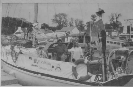
Le Vahiné - Ville de Bordeaux ouvre la route du Danube