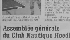
Superbe bébélot tiré dans un petit coin de la Maison du club