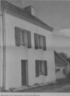
Maison où séjourna Claude Monet