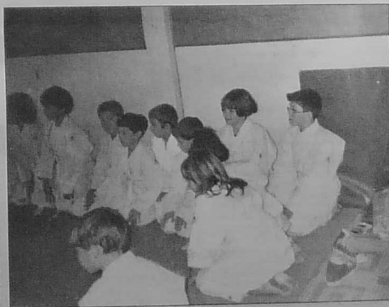
Les jeunes élèves