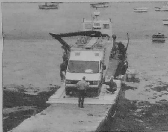
Débarquement du premier camion sur la cale Ko

Outre les commerçants et les logeurs, se frottent également les mains les "figurants" qui ont déjà commencé à travailler un peu, avec des horaires drastiques qui ont surpris certaines. Leur sélection a été particulièrement sévère ; à preuve : lorsque, naïvement, j'ai voulu me présenter sur les rangs avec les autres, je me suis fait rapidement déborder à la gaffe. Motif ? "Ce n'est pas un film d'épouvante que nous tournons, Monsieur !" Bravad !