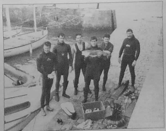
Retour de la chasse sous-marine