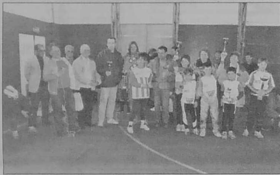
Tous les vainqueurs avec les responsables