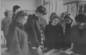
Exposition de la salle Omahaba de Palais

Une exposition toute en couleurs, qui aura pu voir une tendresse, une sensibilité à la fois, sera dévoilée à la salle Omahaba de Palais durant la semaine nationale de mobilisation au profit du Sida (Syndrome d'immuno-déficience Acquis).