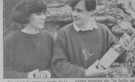
Un régal de pousse-pieds de la belle sauvange Belle-Île est un retour vers le vrai goût breton, celui de la mer. C'est un peu le feu gras de la mer. Il n'a rien à voir avec les beurres de cristaux ou de saumon, encore moins avec celui de "norm" commercialisé en Europe. Il habille les repas d'un petit air de fête et à l'avantage de faire travailler des pêcheurs bellois et d'aider une famille à demeurer dans l'île.

Variations sur un thème connu, la chaisson de Vouly entraîne une histoire sentimentale entre Belle-Île et Marie Galante. Les deux îles sont liées toutes de ce rapprocher, du moins par les idées. Un jumelage des officiers de tourisme, puis une tentative de rencontre sportive entre footballers de la région parisiennaise, d'origine antillaise et du club de l'A.S. I. Enfin deux produits régionaux s'associent: le régal de pousse-pieds et le rhum blanc. Il nous conviendrait de beaucoup d'années dans les chambres du quartier latin.