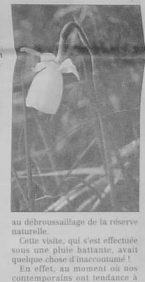
au débarrasage de la réserve naturelle.

Les 6, 9 et 12 du mois courant, la Société d'Economie Agricole (S.E.A.) et l'Office du Tourisme de Fouassier d'un part, et la Société d'Etudes pour l'Équipement de la Vallée de la Rive (S.E.P.E.V.) d'autre part, avaient prévu des sorties en vue de permettre aux amoureux de la nature de se rendre à Saint-Nicolas admirer la faune et la flore de Glénan qui n'accepte de pousser que dans l'écloppé.