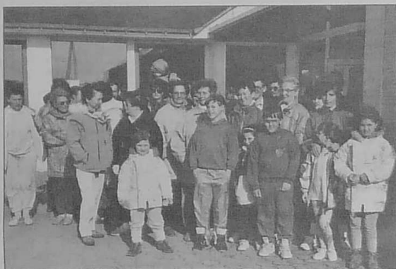
Ils partirent cinquante...