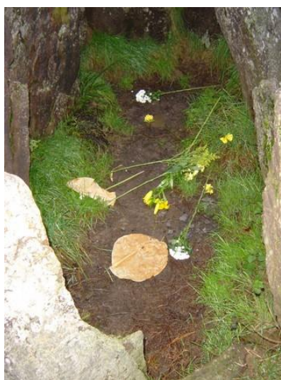
Hôtie de Viviane