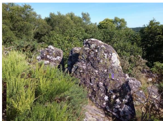
Dents de Merlin

Alors la moindre des choses que nous pouvons faire, en tant que Druides mais en tant qu'Hommes également, c'est de participer à la protection de la forêt et de ceux qui y vivent, visibles ou invisibles. C'est en ramassant les débris là où nous allons, c'est en veillant à la sécurité des lieux notamment vis-à-vis des incendies de forêt. C'est aussi en expliquant la forêt pour que ses visiteurs la comprennent, l'apprécient et de là la respectent. C'est en veillant aussi à ce que les projets des Hommes soient respectueux des lieux, ce qui n'est malheureusement pas toujours le cas.