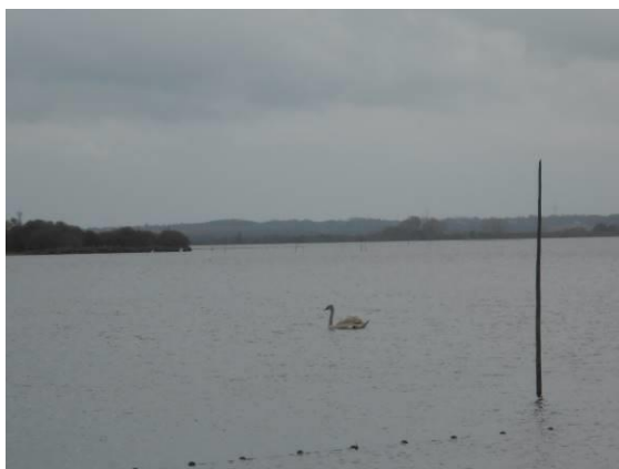
Pierre Aiguë, St Aignan de Grandlieu

Le lac de Grandlieu est un espace paradoxal, marqué à la fois par la stagnation de ses eaux concentrées dans une cuvette géologique exceptionnellement peu profonde, et par leur dynamisme dû à une hydrographie versante et déversante très active. C'est un espace à la fois horizontal, la vue portant parfois à des dizaines de kilomètres, et vertical en raison des nombreuses strates végétales et aquatiques qui le composent ; un lieu fixe par le dessin de ses berges, le chapelet de ses clochers, et néanmoins mouvant par ses prairies inondables et ses fantomatiques levis , ces vastes îles végétales dérivant sur l'eau au gré du vent et des légers courants. Un visiteur sensible pourra ressentir à Passay ou, de façon plus nette encore, à Pierre-Aiguë (St Aignan de Grandlieu) de fortes énergies à l'œuvre.