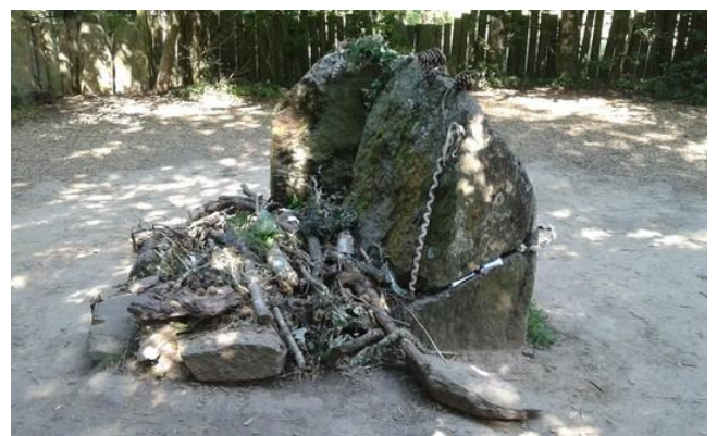
Le Tombeau de Merlin