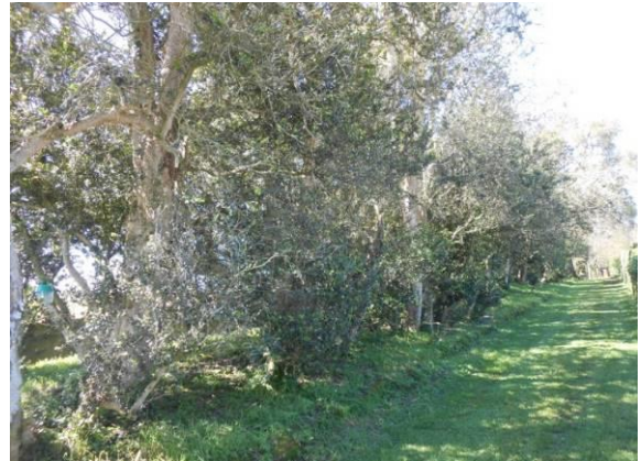
L'allée des Buis à Saint-Lumine de Coutais