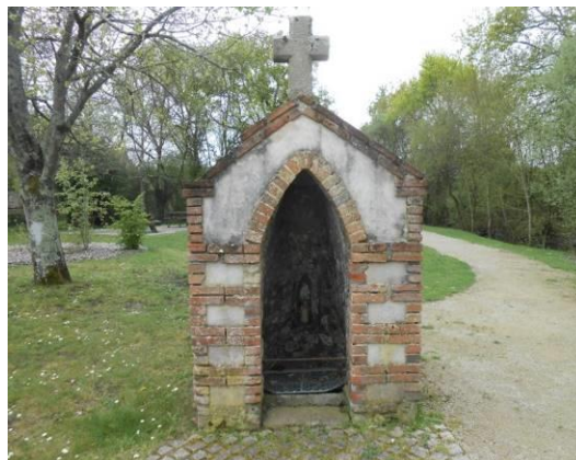
Fontaine Saint-Rachou à Saint-Aignan de Grand Lieu

L'eau bienfaisante et sacrée est vénérée autour du lac, notamment à Saint-Aignan de Grand Lieu, sur le site de la fontaine Saint-Rachou , dont les eaux miraculeuses soignaient la teigne du lait du nourrisson, également appelée rache . A Vue se dresse l'imposante fontaine miraculeuse Ste Anne, bâtie sur les vestiges d'une ancienne fontaine gallo-romaine.