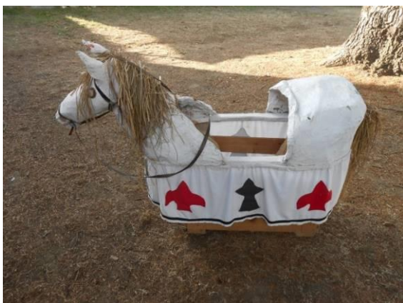
Cheval-jupon à Saint-Lumine de Coutais

de la commune. Un homme ayant enfilé un cheval-jupon (rappelant peut-être celui porté lors de la fête de Satios) incarnait le cheval Mallet et était accompagné d'une étrange procession très codifiée : deux officiants portaient devant lui un bâton fleuri, hypothétique et lointain rappel du bâton druidique, deux autres le suivaient, ferraillant avec des épées. Le cheval se rendait au pied d'un mât (ou mai , symbole celtique de l'Axe du Monde) en chêne surmonté de branchages feuillus et le baisait trois fois. Cette cérémonie fut combattue par les ecclésiastiques qui lui reprochaient son impiété et les désordres qu'elle occasionnait. Depuis 1988, quelques habitants de la commune tentent difficilement de faire revivre cette tradition, issue probablement d'un fond païen très ancien célébrant le printemps et la fécondité.