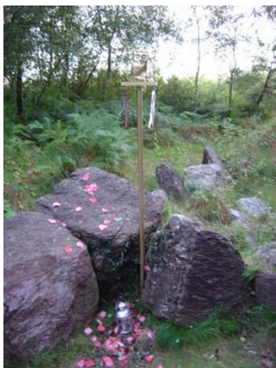
Jardin aux Moines