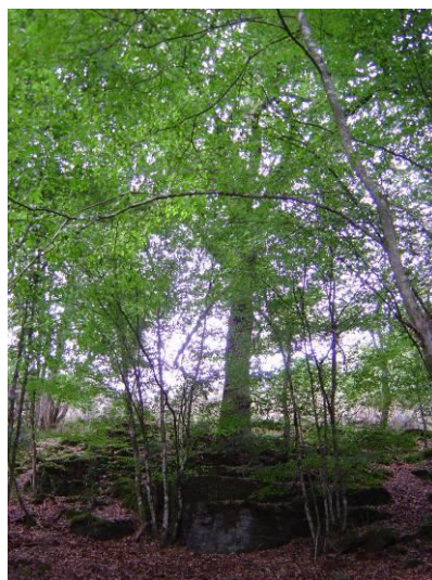
Le Chêne aux Hindrés

Avec la magie de Brocéliande, tout semble devenir possible. Et de fait nous avons pu constater que beaucoup de choses le sont effectivement : rencontres fortuites et enrichissantes, rituels réellement libérateurs et émancipateurs, réunions douces et fraternelles de Clairières pourtant depuis longtemps éloignées, cérémonies de transmission de notre Tradition et de son Sacerdoce, blocages qui se lèvent dans les temps suivant une cérémonie, ... Sans oublier les jeux des enfants, les rires lors de nos pique-niques partagés, et parfois quelques notes de flûte ou de harpe relayées par le vent.