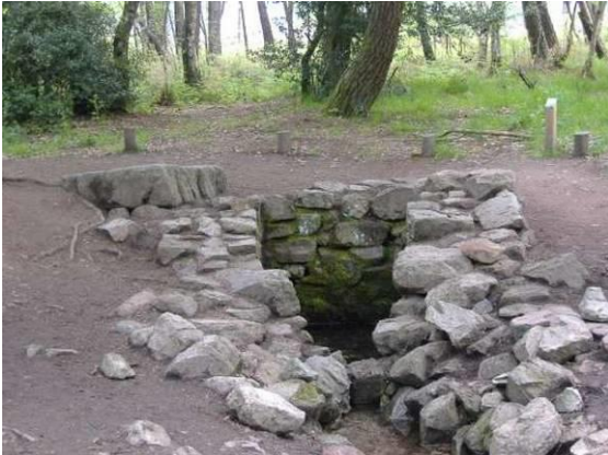
Fontaine de Barenton