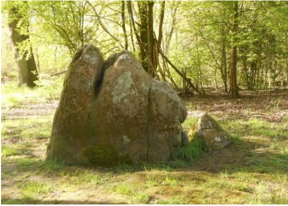
Les Dames de pierre à Pont-Saint-Martin

Un autre lieu remarquable, végétal cette fois, se trouve à St Lumine de Coutais, derrière la chapelle Notre-Dame du Châtelier : le Clos des Buis , situé sur un ancien site gallo-romain, est composé d'un cimetière et d'une allée plantée d'une douzaine de buis bimillénaires. En raison de son feuillage persistant, de sa longévité remarquable et de son bois dur, le buis était dans l'Antiquité symbole d'immortalité. Il surplombe actuellement l'ancien