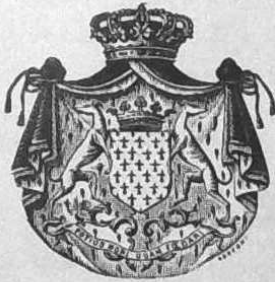
Carte Editions Fleury Luitré (I.et.V.)

OFFICE BRETON DU TOURISME ERGERZH BRETON TOURIST ASSOCIATION