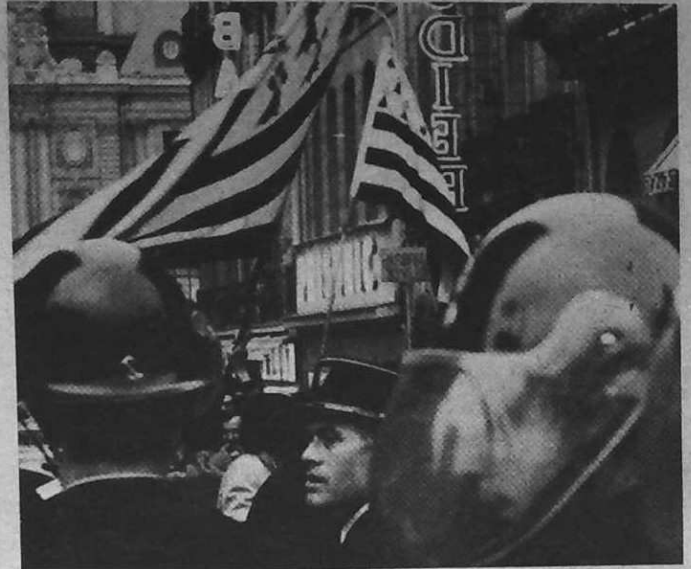
« Nann da justis ar vourc' hizion ! » Malgré la police, le drapeau breton flotte dans les rues de Rennes.

Mais la voie est tracée : ne jamais perdre l'initiative, continuer la mobilisation et répondre coup pour coup. La libération de l'abbé Le Breton montre que l'on peut obtenir des victoires contre l'arbitraire. Le prochain objectif est un rassemblement à Rennes avec des paysans, des petits commerçants, des ouvriers de différents coins de Bretagne.