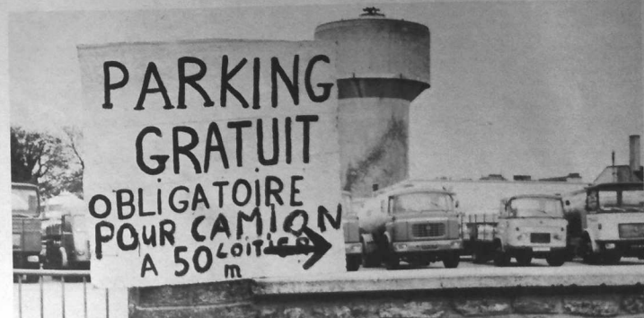
La guerre du lait, c'est aussi une sorte de fête pour les travailleurs. C'est l'occasion de montrer sa détermination... et comme on le voit sur la photo, son humour.

Il faudra que les « pontes » s'y fassent : la guerre du lait 1972, c'est un peu le « Joint Français » des paysans. Et ça laissera des traces.