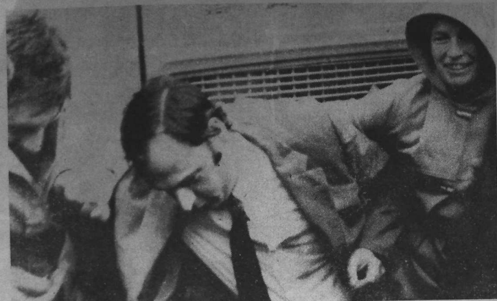
« Les femmes dans la rue, pas dans la cuisine ! » crient des manifestantes lors du défilé de 30 000 personnes à Paris. Dans le Finistère, des centaines d'agricultrices ont montré que les femmes savent participer quand il le faut à la lutte. Sur la photo, elles aident à entraîner un cadre de la direction de la laiterie Le Gall à l'intérieur des locaux.

L'an dernier, il y avait quelques actions isolées, aujourd'hui, elles surgissent de partout. Ce ne sont pas les états-majors qui en ont décidé ainsi, c'est souvent au niveau du canton ou de la commune que la décision est prise. A Landerneau, les 400 paysans du canton de Saint-Renan ont décidé, par vote à main levée, de séquestrer. A Guiscriff, un paysan explique comment s'est préparée l'action : « On était sensibilisés, on a formé des commandos qui parlaient tous les jours arrêter les camions et on a décidé de les garder sur la place. Les responsables ont été poussés, ça on peut dire, ils étaient débâchés, même ils ont voulu trainer... C'est notre mouvement, on n'a pas attendu qu'ils viennent nous dire quoi faire, on n'a pas d'ordre à recevoir de personne... »