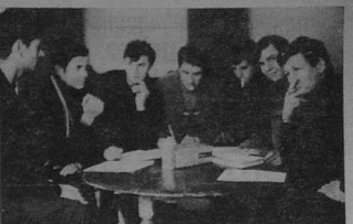
La réunion d'équipe, pièce maîtresse du système