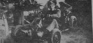
Un élève de la classe de sept