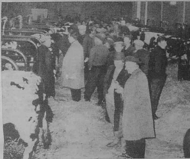
En élevage, la réussite est fonction des conditions d'entretien des animaux. Les pertes occasionnées par une hygiène défectueuse et les maladies (tuberculose, fièvre aphteuse, brucellose) ont pu être évaluées à 12 % de la valeur des productions animales.