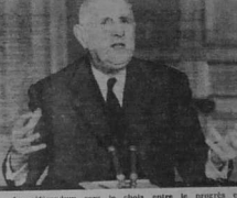
Le référendum sera le choix entre le progrès et le statu quo.