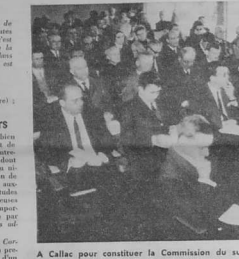
A Callac pour constituer la Commission du sud-ouest des Côtes-du-Nord.