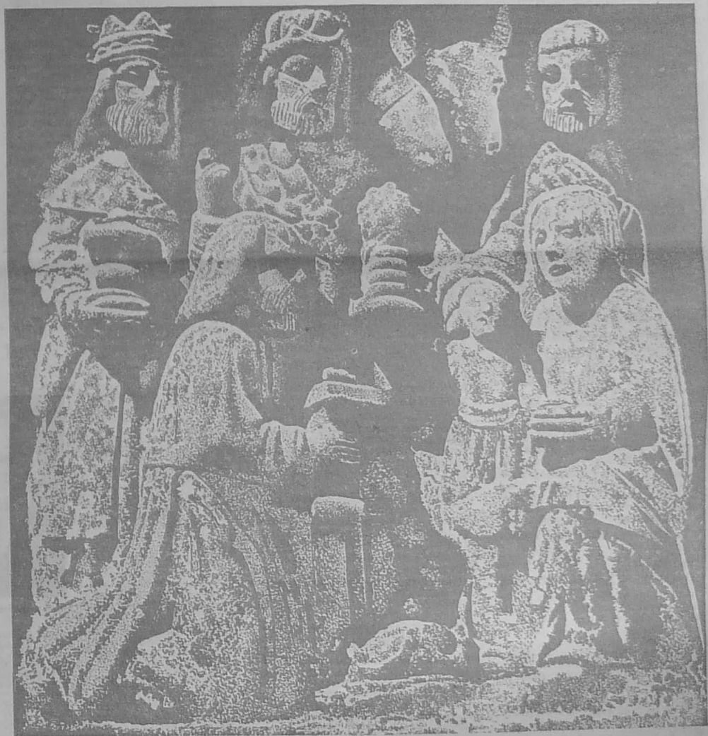
Couverture de la pochette du disque — troisième d'une série consacrée à « nedeleg » — « NouËl NouËl ».

LES GROUPEMENTS DE PRODUCTEURS, EN BRETAGNE