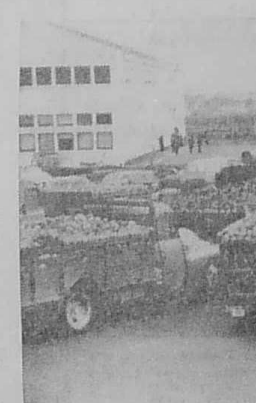
Les artichauts arrivent au marché de ventes aux enchères de Saint-Pol-Kérinel. Le mouvement qui a suscité les groupements de producteurs est parti d'ici.

Les principaux groupements sont soit des coopératives, soit