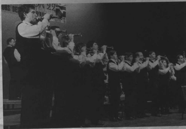
2 ème : Bagad Sonerien an Oriant