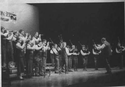
4 ème : Bagad Penhars