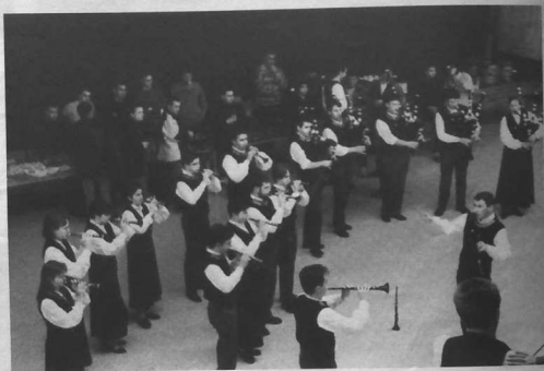
3 ème : Bagad Beuzeg ar C'hab