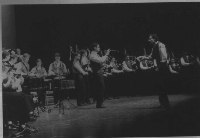
1 er : Bagad Plougastell