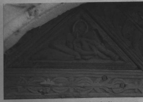
Détail du tympan de la porte de la chapelle d'Avoignour, en Saint-Pever, dans les Côtes d'Armor