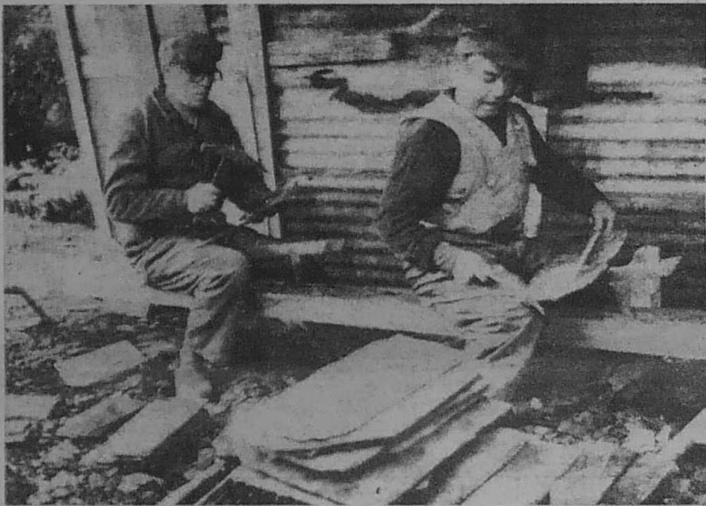
La taille des ardoises historiques dans le bassin de Châteaulin.

Une richesse du sous-sol à mieux exploiter