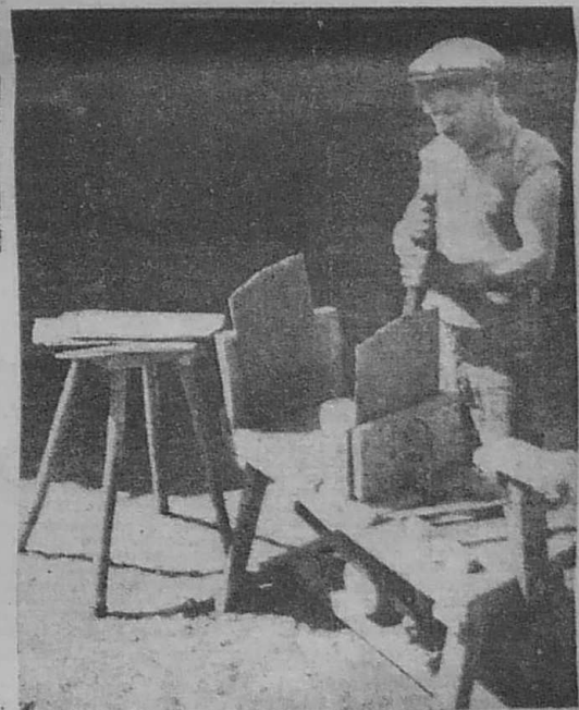
Le découpage des feuilles.

Une richesse du sous-sol à mieux exploiter