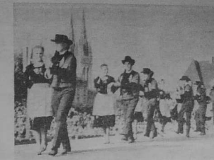
Les « catifed » ou « Singsala » sur le podium des fêtes de Cornouaille.

LES FÊTES DE CORNOUILLE défilent officiellement les plus grandes fêtes folkloriques de France. Elles réunissent à Quimper le 4 dimanche de juillet, tous les cercles celtiques de Bretagne. Le Grand défilé des Cercles bretons, le Grand Assemblée, la Danse des Mille et le triomphe des Semeurs ont gagné une réputation internationale. Des 1948 elles avaient été organisées dans une optique morale, en l'honneur de l'évolution générale. Cette évolution ne cesse de se poursuivre et le Comité a révisé l'organisation des fêtes de Cornouaille en semaine celtique. Les responsables s'en expliquent ici. Ce renouveau est pointé par nous en 1968, mais les événements de mai-pas ont rendu indispensables les échanges et le travail nécessaires à la préparation.