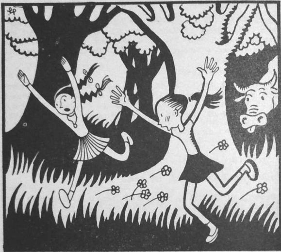
... e oa an aneval... o redeg etrezeg ennom