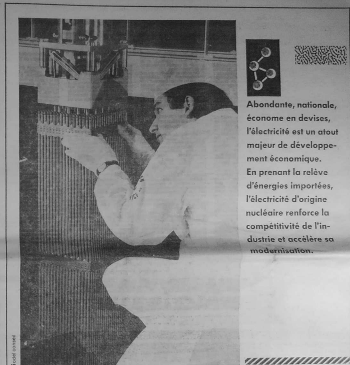
S. de la conseil

Opticien spécialiste diplômé acoustique et lentilles coordonnées 47, avenue Roger-Salengro - CHAMPIGNY Téléphone : 42.83.80.85 Montreaux - Villiers-Optique - Ivry-Optique - Brie-Optique 24, avenue Gallieni - 94 JOINVILLE-LE-PONT Téléphone : 48.83.91.91