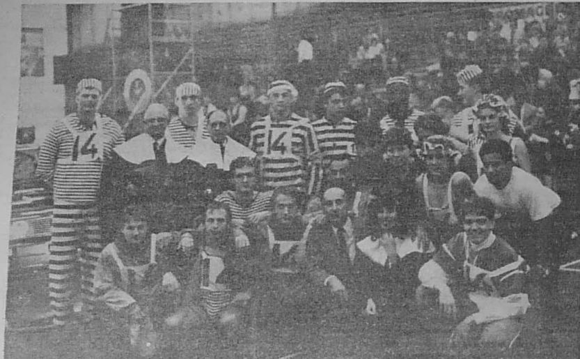
L'équipe de tireurs à la corde en habit rayé.