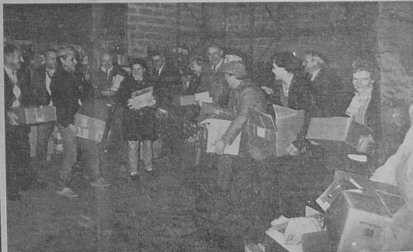
Ce jour-là, toutes les amicales s'étaient donné rendez-vous à Pantin, chez Botrans, où sont rassemblés les livres pour expédition vers Haïti. Le débarquement des cartons de livres a été effectué dans la bonne humeur.